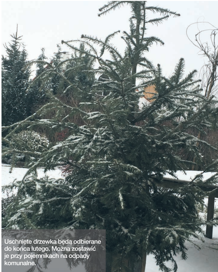
Uschnięte drzewka będą odbierane do końca lutego. Można zostawić je przy pojemnikach na odpady komunalne.

Co zrobić z choinką po świętach? Można ją zostawić przy pojemnikach na odpady komunalne. Uschnięte drzewka będą odbierane do końca lutego.