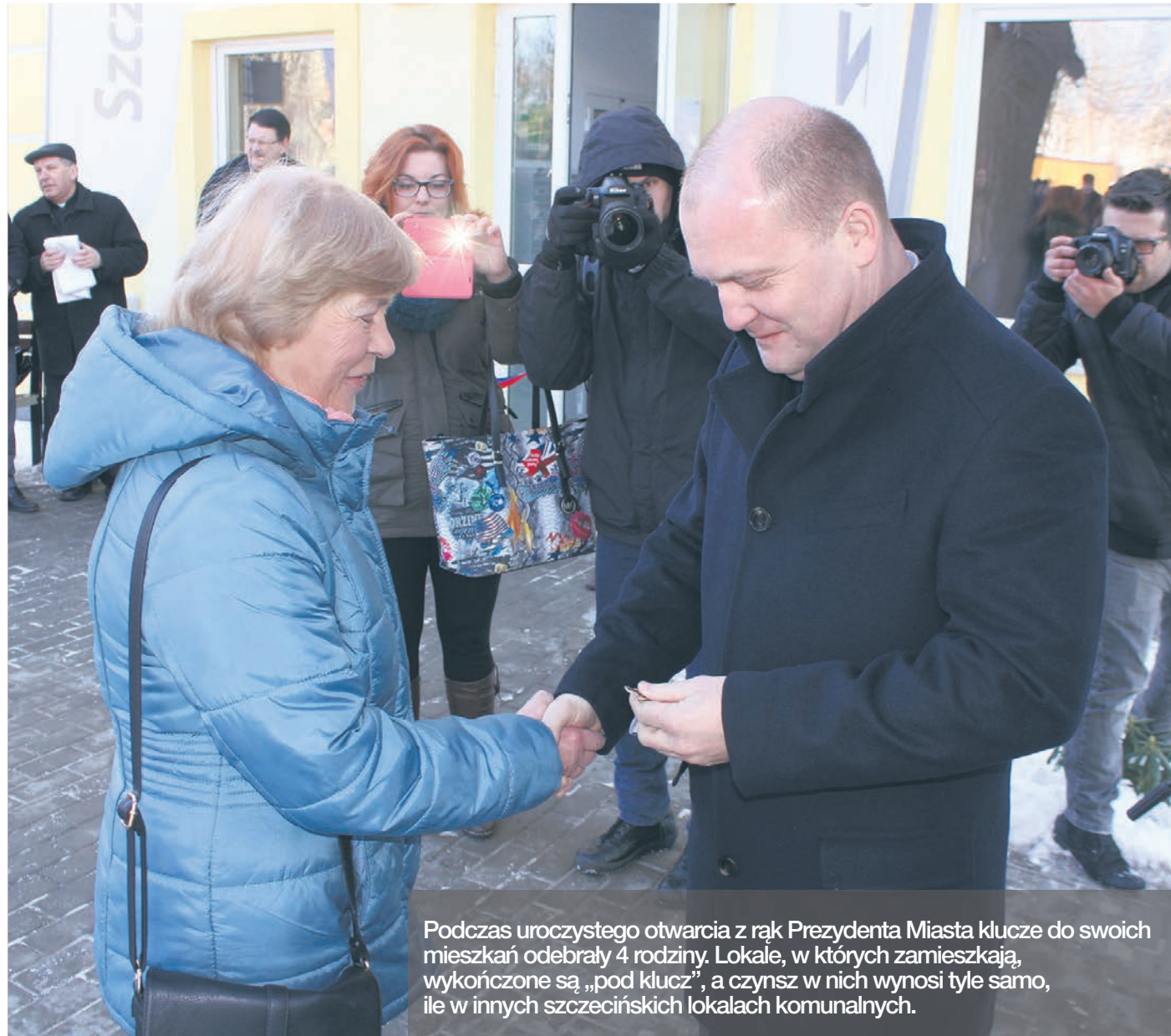
Podczas uroczystego otwarcia z rąk Prezydenta Miasta klucze do swoich mieszkań odebrały 4 rodziny. Lokale, w których zamieszkają, wykończone są „pod klucz”, a czynsz w nich wynosi tyle samo, ile w innych szczecińskich lokalach komunalnych.

A wszystko to w centrum Starego-Dąbia, które rewitalizowane jest przez TBS od 2002 roku. Osiedle „Nad Płonią” położone jest przy bocznej uliczce