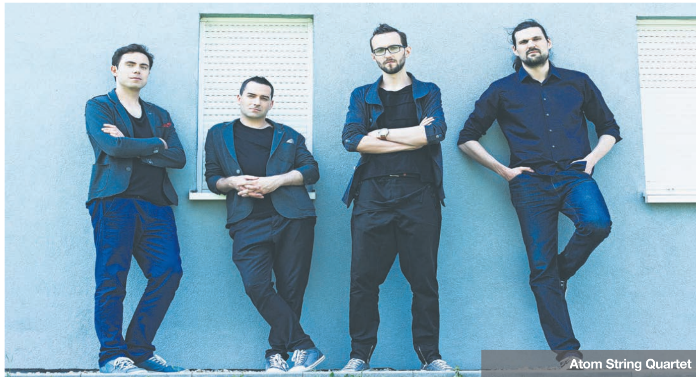
Atom String Quartet

W lutym niełatwy będzie także wybór koncertu w wykonaniu polskich artystów tzw. muzyki popularnej. Tak więc odnotujemy tylko w telegraficznym skrócie: