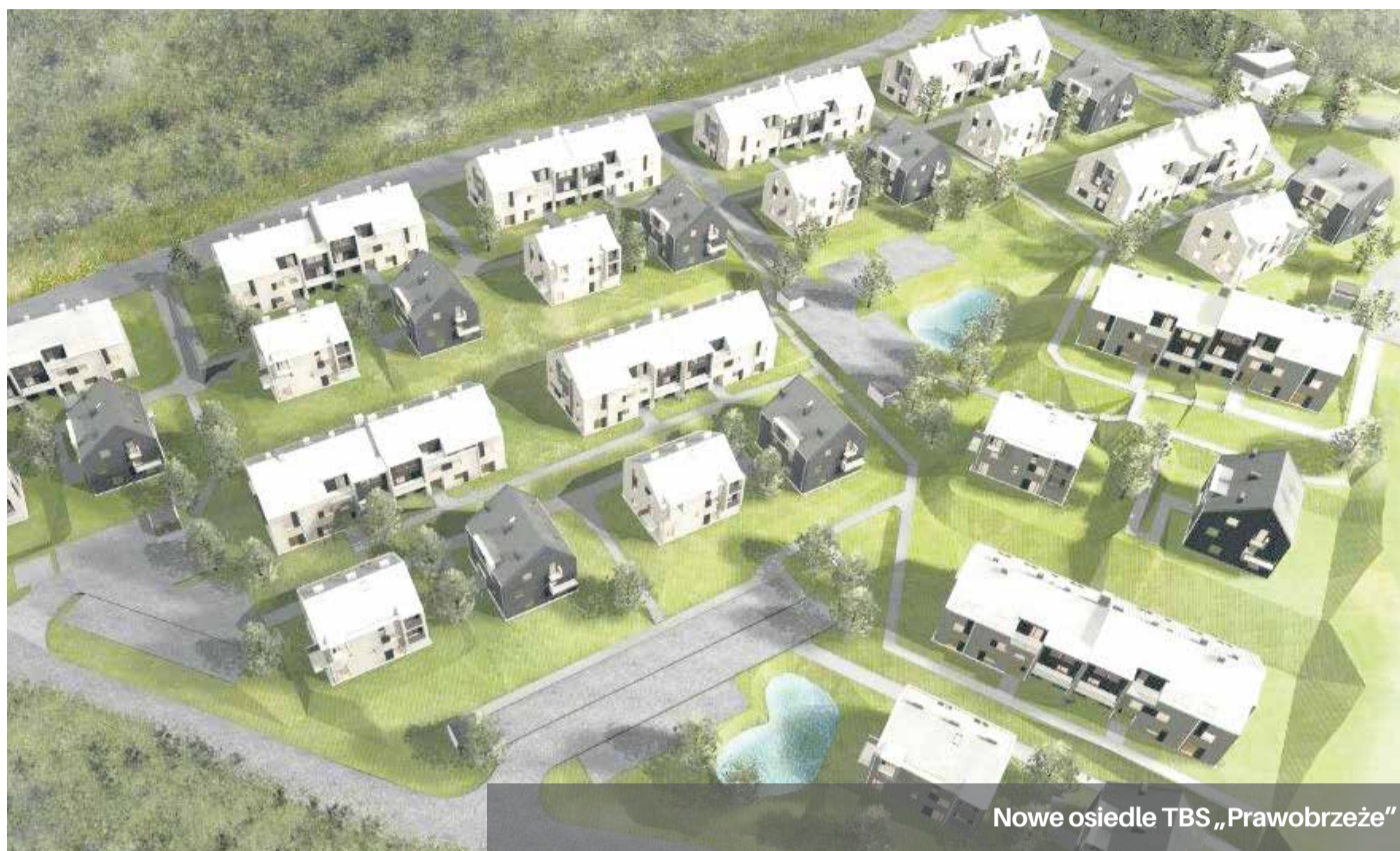
Nowe osiedle TBS „Prawobrzeże”

Na osiedlu będzie 280 mieszkań w 10 budynkach z trzema kondygnacjami