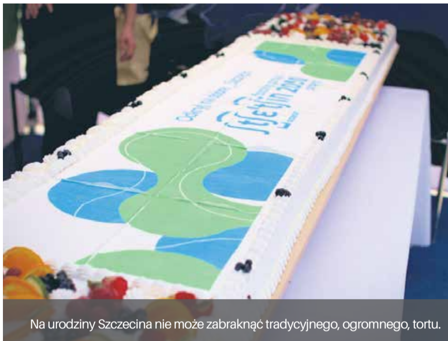
Na urodziny Szczecina nie może zabraknąć tradycyjnego, ogromnego, tortu.

Oczywiście, nie może także zabraknąć akcentów historycznych, nawiązujących do pierwszych lat powojennych Szczeci-