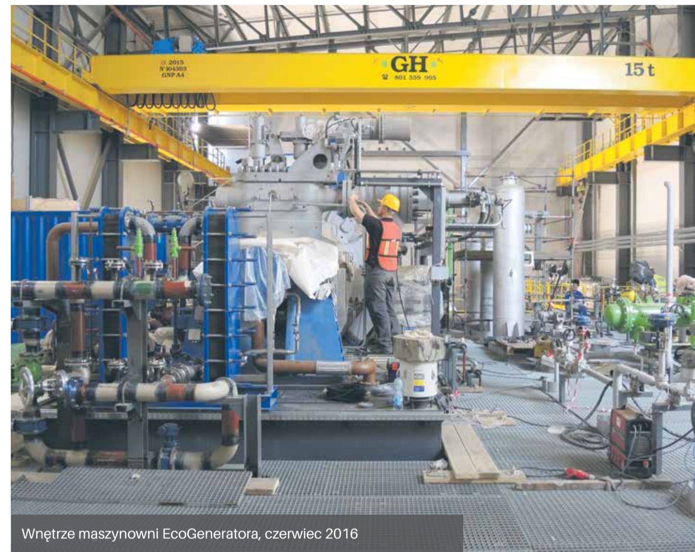
Wnętrze maszynowni EcoGeneratora, czerwiec 2016