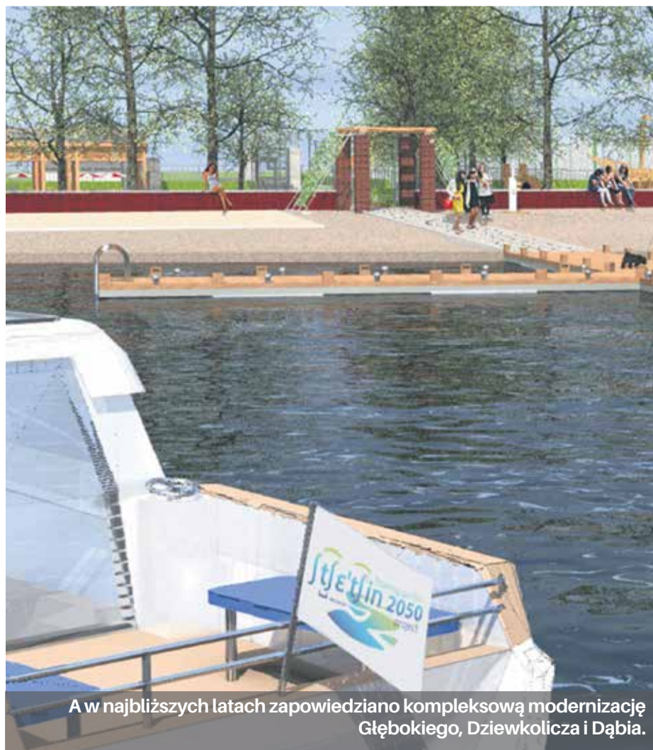
A w najbliższych latach zapowiedziano kompleksową modernizację Głębokiego, Dzwonklicza i Dąbia.

Przy kasach wejściowych oraz przy parkingu zamontowane zostały elektroniczne wyświetlacze.