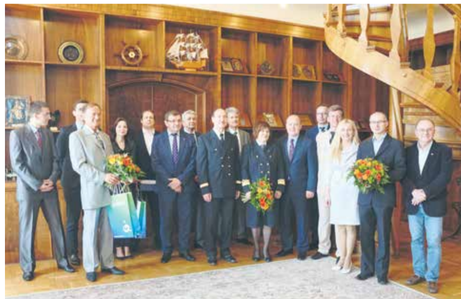
Nagrodzeni za najlepsze prace dyplomowe magisterskie i doktorskie ukierunkowane na nowoczesne technologie i innowacje.

Pięcioro uzdolnionych naukowców otrzymało nagrody od prezydenta Szczecina Piotra Krzystka za najlepsze prace dyplomowe, magisterskie i doktorskie ukierunkowane na nowoczesne technologie i innowacje.