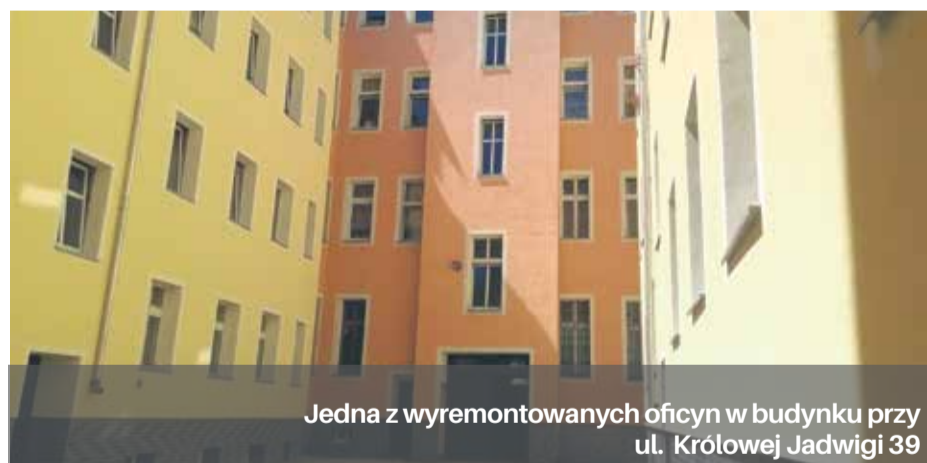
Jedna z wyremontowanych oficyn w budynku przy ul. Królowej Jadwigi 39

Widoczne są już pierwsze efekty dodatkowego wsparcia finansowego przeznaczone na remonty kamienic.