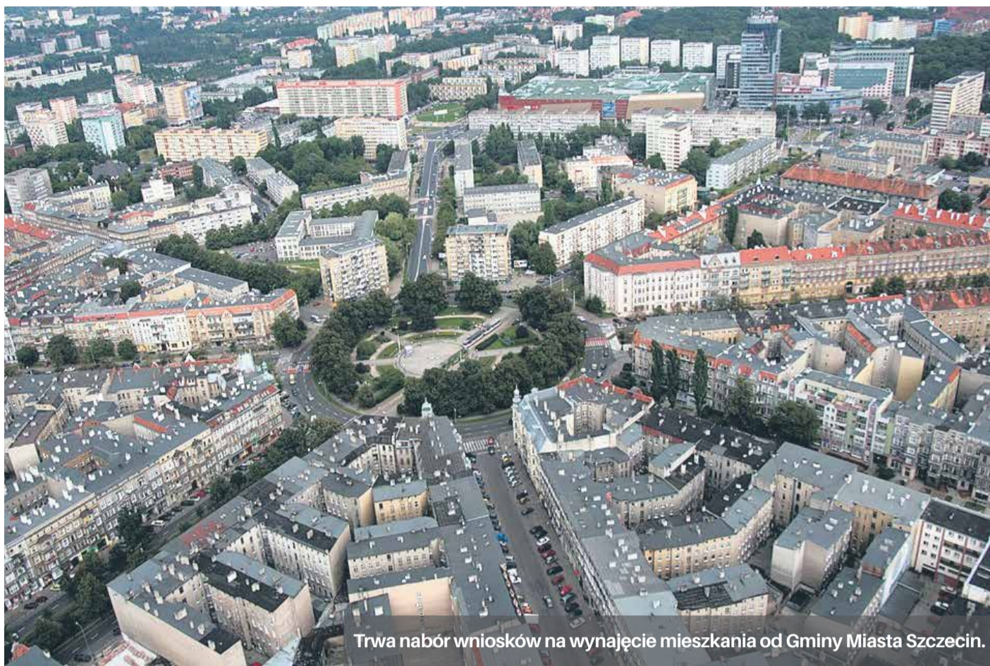
Trwa nabór wniosków na wynajęcie mieszkania od Gminy Miasta Szczecin.

Szczegółowe informacje na temat zasad najmu mieszkań z zasobu Gminy Miasta Szczecin i TBS pod numerem telefonu ZBiLK BOI 91-48-86-301, 91-48-86-333 i na stronie internetowej www.zbilk.szczecin.pl