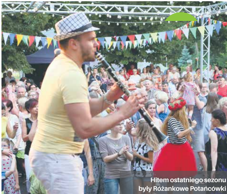
Hitem ostatniego sezonu były Różankowe Potańcówki

Różana Czytelnia – plenerowa strefa wolnych książek czynna będzie codziennie , nie tylko w weekendy. Każdy kto odwiedzi Różany Ogród od 2 czerwca do 27 sierpnia br. będzie mógł zostawić, wziąć lub przeczytać książkę na miejscu. Nasz projekt jest częścią ogólnopolskiej akcji „uwalniania książek”, który wielu osobom daje szansę na obcowanie z książką, bez konieczności jej zakupu.