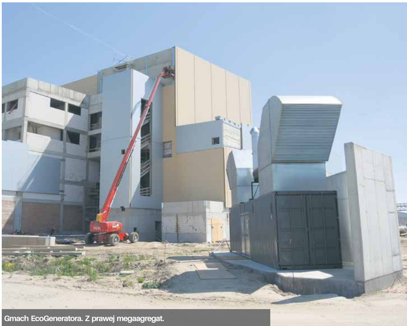
Gmach EcoGeneratora. Z prawej megaagregat.