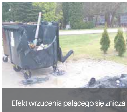
Efekt wrzucenia palącego się znicza

Zlikwidowane zostaną granitowe płyty leżące na ziemi z wygrawerowanymi danymi osób zmarłych. Te nazwiska mogą być umieszczone tylko w wyznaczonych do tego miejscach. Tablice zostaną przewiezione do administracji cmentarza i tam przechowane przez maksymalnie 6 miesięcy. Przepisy regulują także obowiązki opiekunów grobów przy umieszczonych w ścianach urnowych.