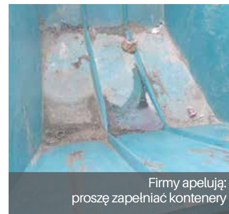
Firmy apelują: proszę zapełniać kontenery

Dlatego apelujemy i prosimy, aby właściciel lub zarządca zgłaszając nieruchomość był przygotowany do załadunku i odbioru kontenerów w takim okresie czasu.