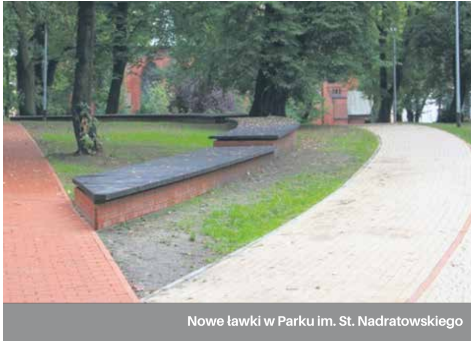
Nowe ławki w Parku im. St. Nadratowskiego

Na terenie Osiedla Gołęcino - Goclaw , przy ulicy Światowida rozpoczęły się prace przy realizacji inwestycji pn. „Park Liga” . Projekt zagospodarowania terenu został