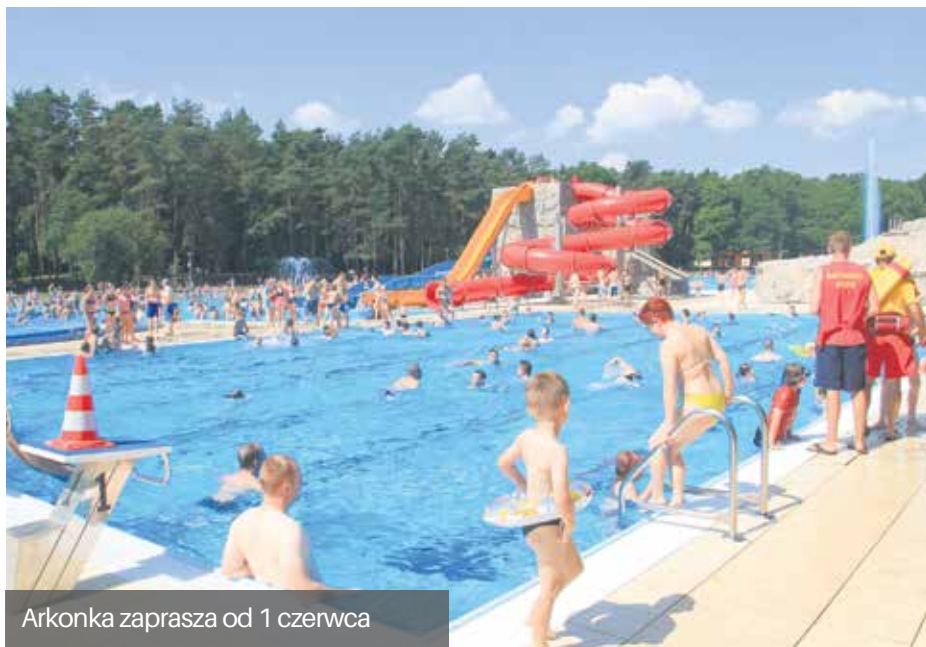
Arkonka zaprasza od 1 czerwca

Niedługo swoje podwoje otworzą szczecińskie kąpieliska. Najwcześniej, bo już 1 czerwca, zaprasza Arkonka.