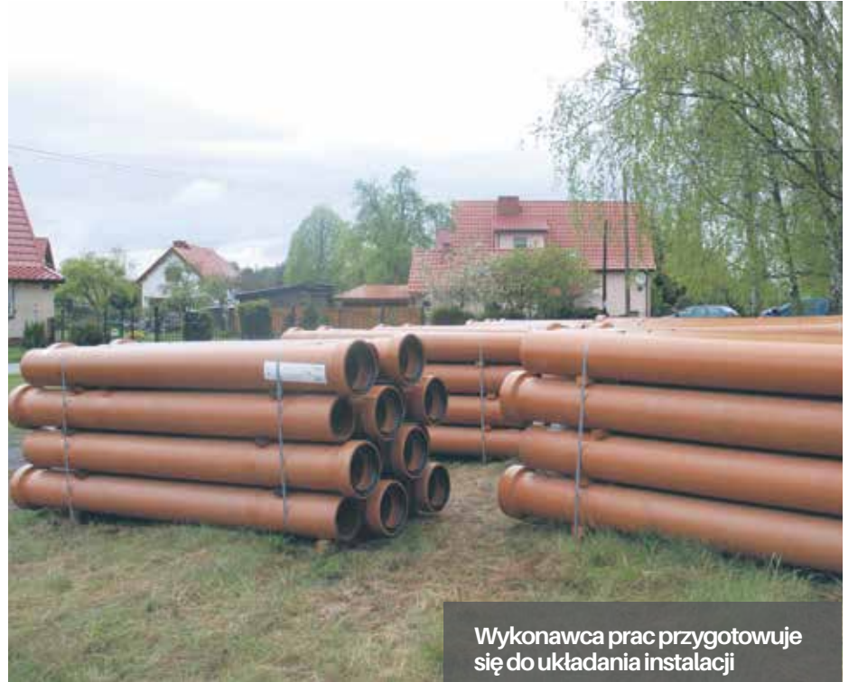
Wykonawca prac przygotowuje się do układania instalacji

W kolejnych latach wykonane będą dalsze etapy budowy kanalizacji obu osiedli w prawobrzeżnej części miasta.