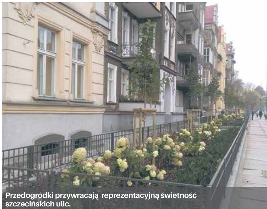
Przedogródki przywracają reprezentacyjną świetność szczecińskich ulic.

Ogródki przed kamienicami, miejsca rekreacji i place zabaw w oficynach powstaną w 24 wspólnotach mieszkaniowych.