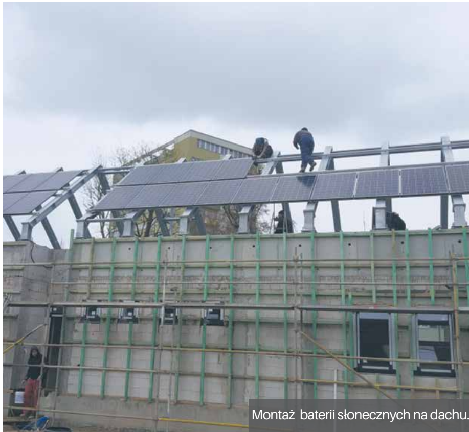
Montaż baterii słonecznych na dachu.

W całości zrobiona jest także instalacja wodociągowa, również już podłączona do sieci miejskiej.