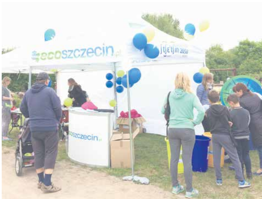
Pierwszy tegoroczny festyn w parku Kurzeby