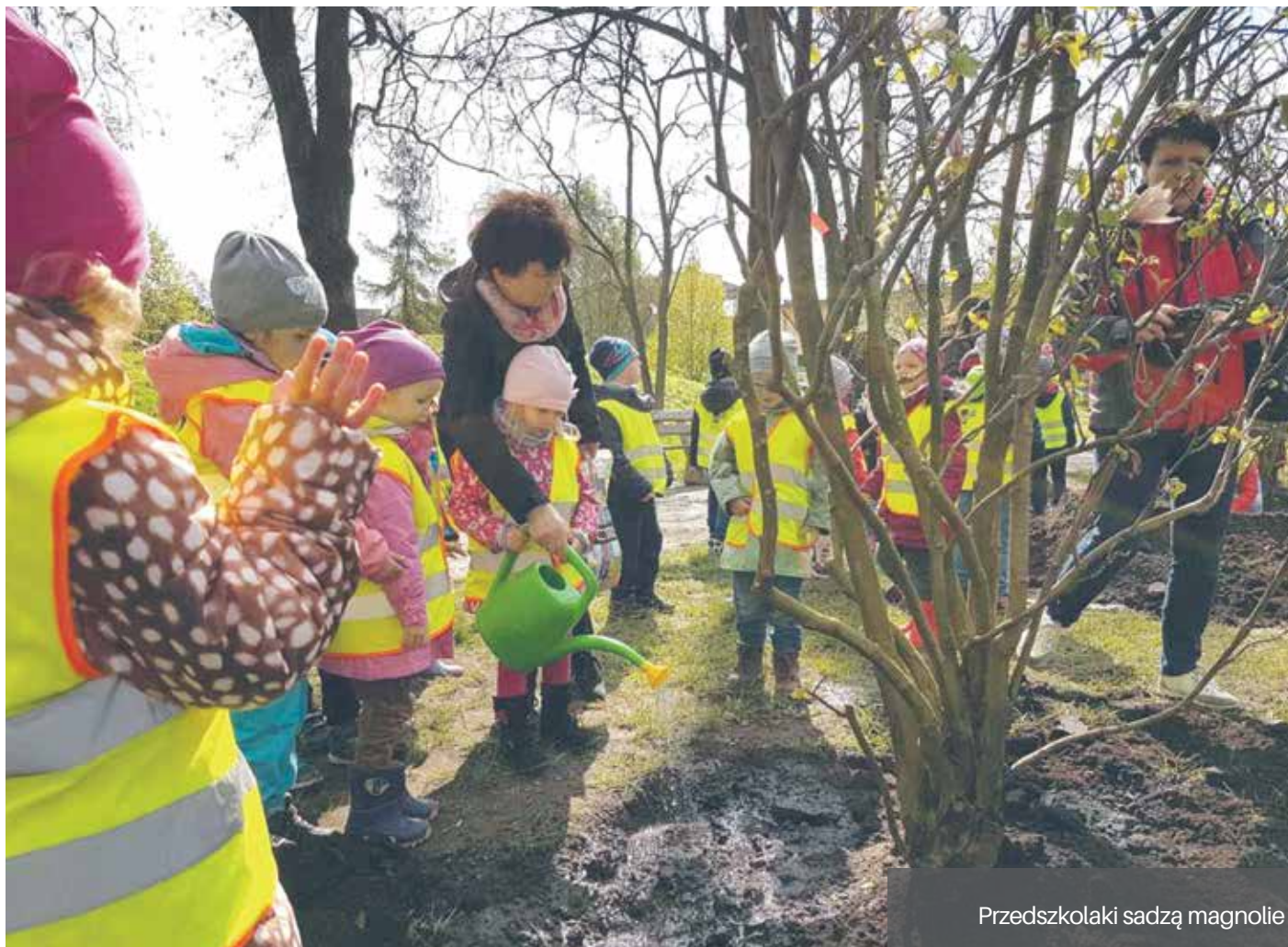
Przedsiębiorcy sadzą magnolie