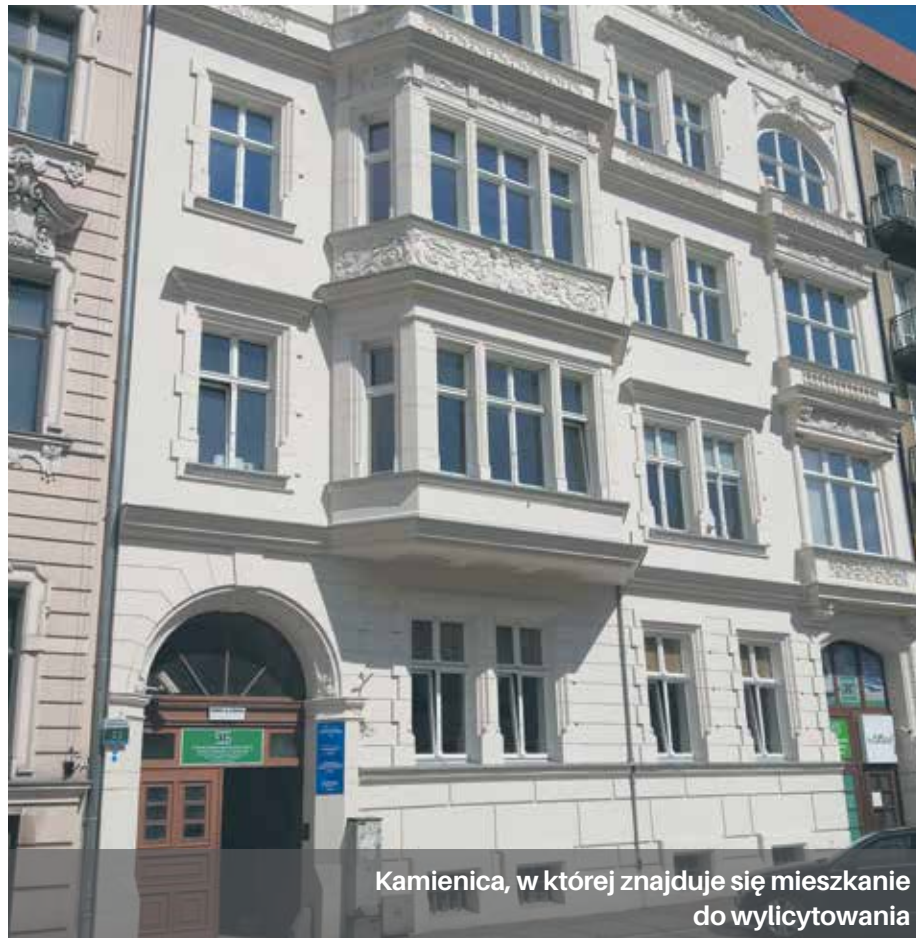
Kamienica, w której znajduje się mieszkanie do wylicytowania