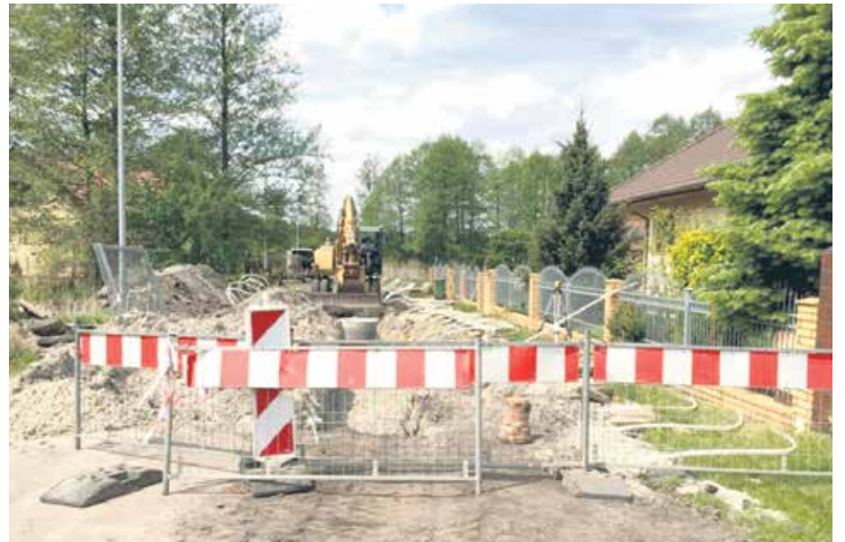
Prace na ul. P. Robiena