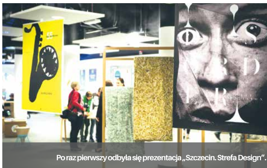
Po raz pierwszy odbyła się prezentacja „Szczecin. Strefa Design”.