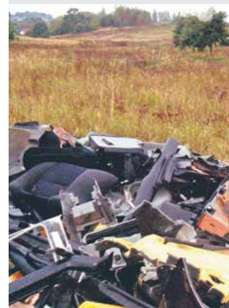
ul. Mistrzowska „Wysypisko” części samochodowych.