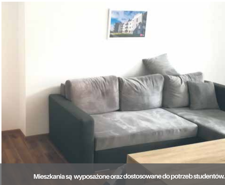
Mieszkania są wyposażone oraz dostosowane do potrzeb studentów.

Z początkiem roku akademickiego kolejni studenci zamieszkali w lokalach przygotowanych przez miasto. Tym razem do czterech mieszkań Szczecińskiego TBS wprowadziło się 17 zaków.