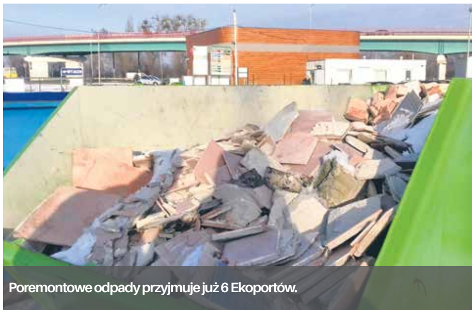
Poremontowe odpady przyjmuje już 6 Ekoportów.

Nieustannie, niemal w każdym wydaniu powtarzamy i apelujemy w sprawie odpadów remontowych.