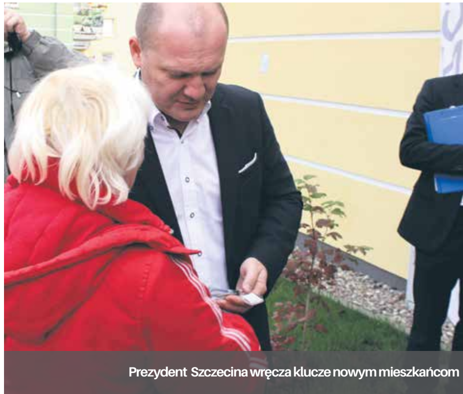
Prezydent Szczecina wręcza klucze nowym mieszkańcom

Całą inwestycję zaplanowano do realizacji w sześciu etapach, w latach 2014 - 2020. W sumie, w tym okresie, powstanie 120 mieszkań w 10 budynkach wielorodzinnych. Lokale wykończane są w standardzie „pod klucz”, tj. posiadają m. in.: kuchenki elektryczne, zlewozmywaki, wanny, umywalki, armaturę sanitarną, w pokojach – wykładziny we współczesnym standardzie, w łazienkach – terakotę oraz płytki ceramiczne, stolarkę okienną i drzwiową. Do niektórych lokali położonych w parterze przynależą ogródki przydomowe, zaś wszystkie mieszkania położone na piętrach posiadają balkony. Część