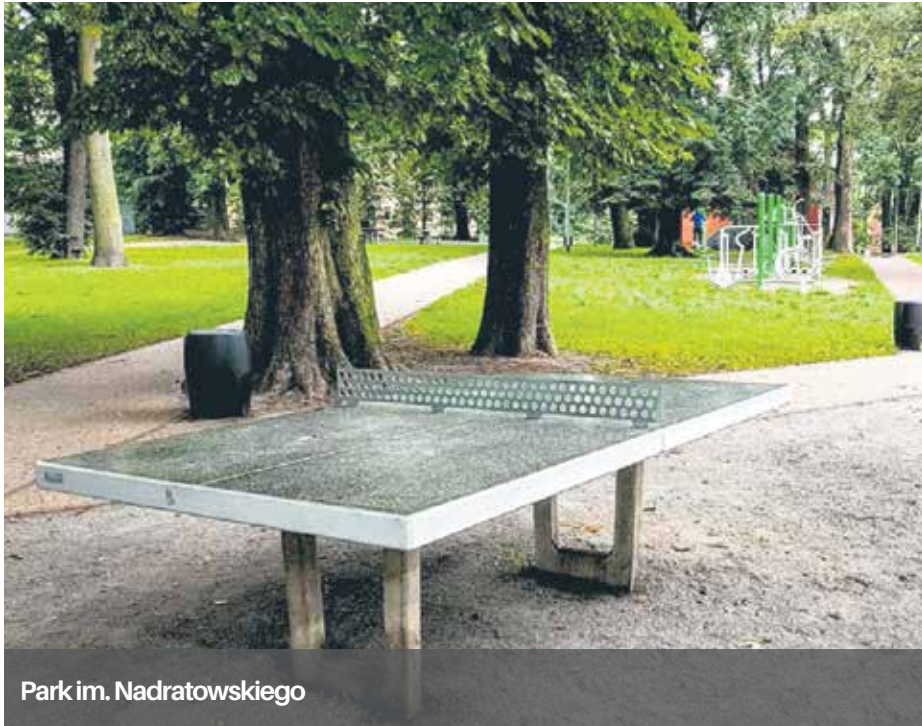
Park im. Nadratowskiego