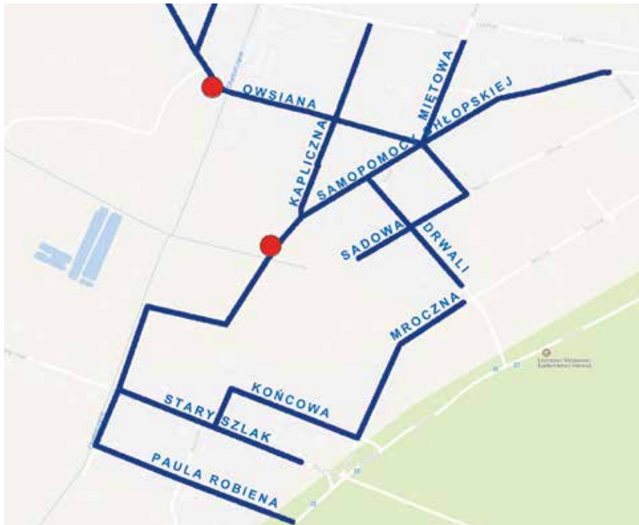
Zakres prac prowadzonych obecnie przez ZWiK

Szczecin jest skanalizowany niemal w całości. ZWiK systematycznie buduje nowe instalacje w miejscach pozbawionych sieci sanitarnej. Spółka zachęca mieszkańców do podłączania się do kanalizacji.