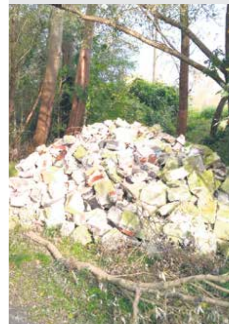
Ul. Księżnej Anny / Zaleskie Łęgi. Sterta gruzu.