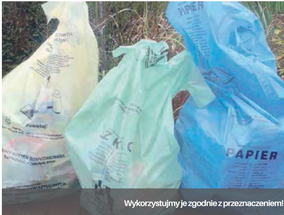
Wykorzystujemy je zgodnie z przeznaczeniem!

Oprócz mieszkańców Szczecina, którzy w większości (ponad 90 procent) deklarują segregację odpadów nadal zachęcamy innych, m.in. szkoły, przedszkola, żłobki i wszystkie placówki oświatowe do segregacji odpadów.