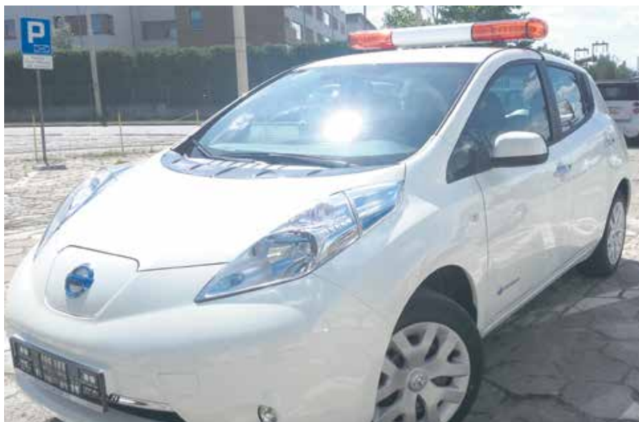
Do Szczecina trafiły już pierwsze pojazdy elektryczne .

W miejskim powietrzu będzie mniej spalin! Szczecin ekologicznie modernizuje swoją flotę pojazdów i kupuje kolejne auta elektryczne, ogłoszono także przetarg na zakup autobusów hybrydowych.