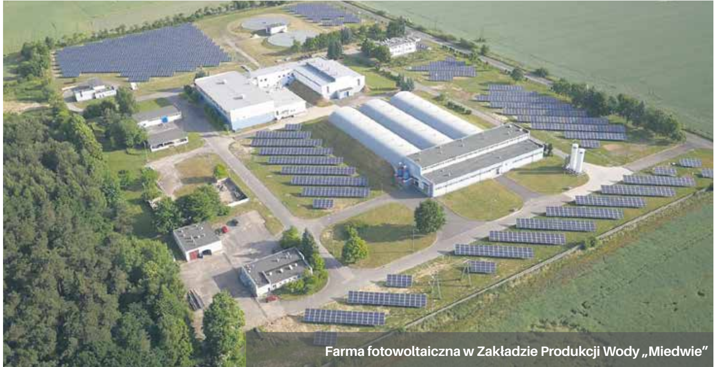
Farma fotowoltaiczna w Zakładzie Produkcji Wody „Miedwie”

Budowa farmy będzie wsparta środkami pochodzącymi z Regionalnego Programu Operacyjnego Województwa Zachodniopomorskiego 2014-2020 współfinansowanego z Funduszy Europejskich. W celu ich pozyskania ZWiK przystąpił do konkursu organizowanego przez Wojewódzki Fundusz Ochrony Środowiska Gospodarki i Wodnej w Szczecinie. Wniosek spółki został oceniony pozytywnie. Umowę o dofinansowaniu podpisano w grudniu ub. roku.