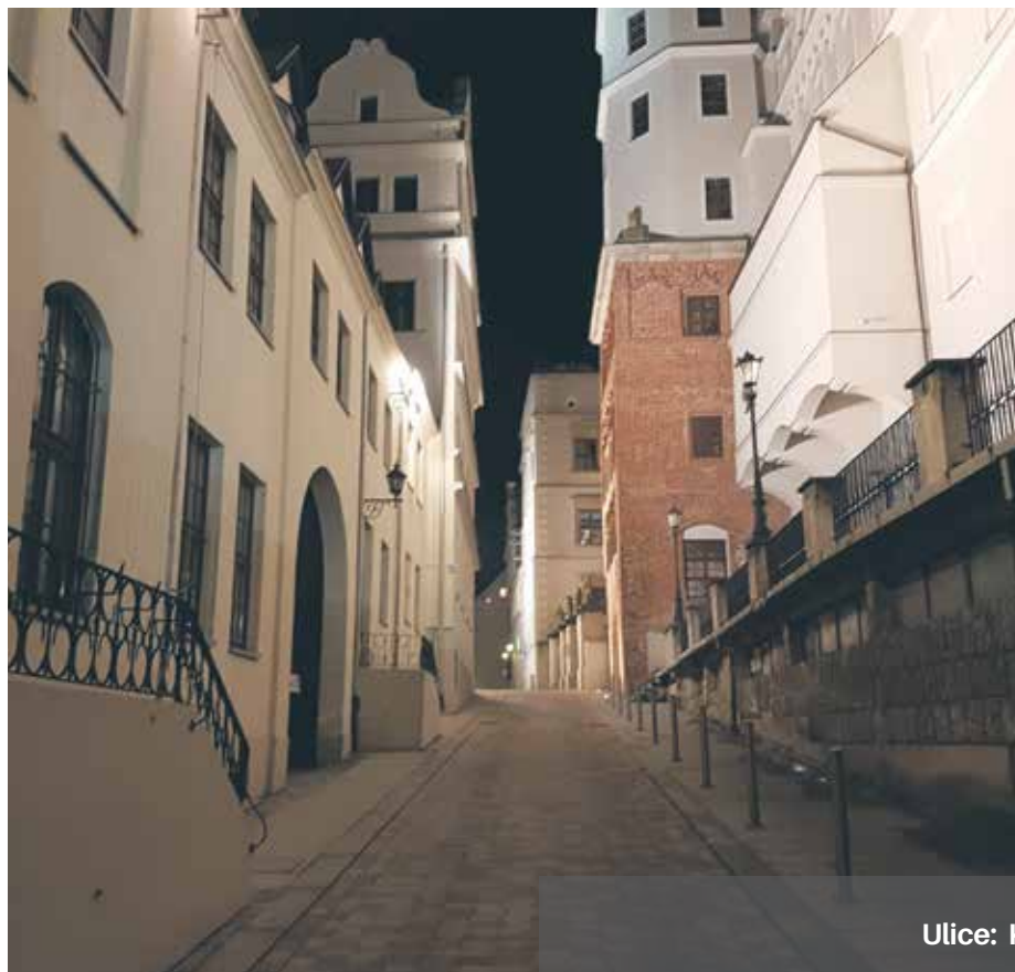
Ulice: Kuśnierska i Wiosenna po przebudowie

Reprezentacyjne ulice w okolicy Wałów Chrobrego także odzyskały swój blask, wygodniej jest dla pieszych i kierowców. Prace odbywały się etapowo w ramach rewitalizacji terenu Starego Miasta. Zadanie podzielone zostało na 3 elementy,