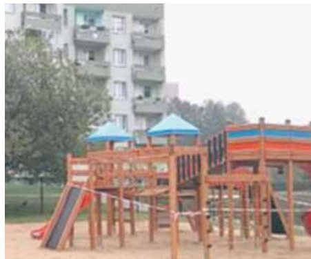
Plac zabaw przy SP nr 35

W ubiegłym roku zakończono kilka ważnych dla osiedli inwestycji. Ukończono również kolejne już etapy z kilku wieloletnich inwestycji.