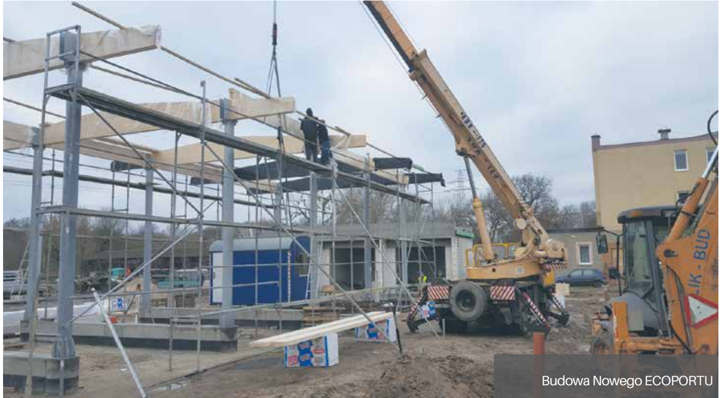
Budowa Nowego ECOPORTU

Na ukończeniu jest wiata czterostanowiskowa, która zamontowane ma słupy z głowicami.