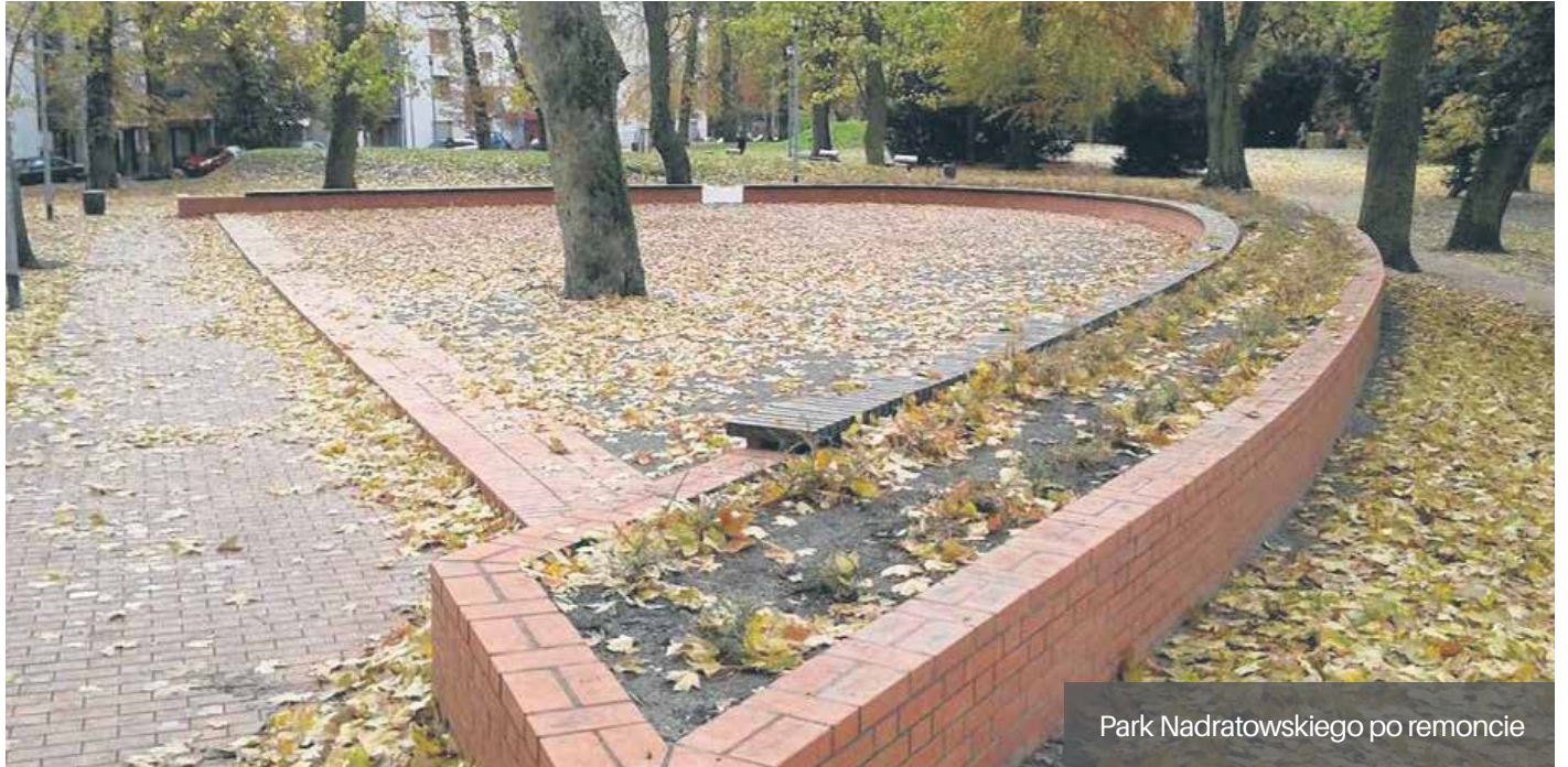
Park Nadratowskiego po remoncie

Decyzja o tym, jaka inwestycja będzie realizowana (także wieloetapowa) należy do Rady Osiedla. W tym przypadku opracowywana jest dokumentacja projektowa i zbierane są niezbędne środki finansowe, a realizacja inwestycji rozłożona jest na kilka lat.