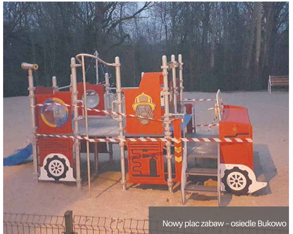
Nowy plac zabaw - osiedle Bukowo

Prace remontowe objęły również swym zakresem fragment ogrodzenia. W roku