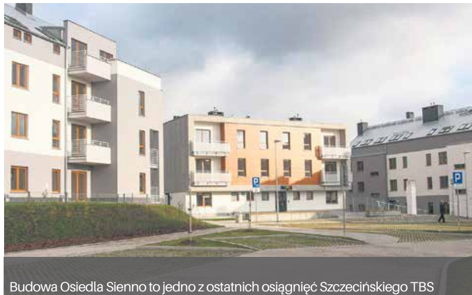
Budowa Osiedla Sienna to jedno z ostatnich osiągnięć Szczecińskiego TBS

Spółka we współpracy z Gminą Miasto Szczecin realizuje także szereg programów społecznych skierowanych do różnych grup - m.in. do dzieci z pieczy zastępczej, usamodzielniających się jej wychowanków, studentów, absolwentów, młodych rodzin, rodzin wielodzietnych wymagających wsparcia oraz seniorów.