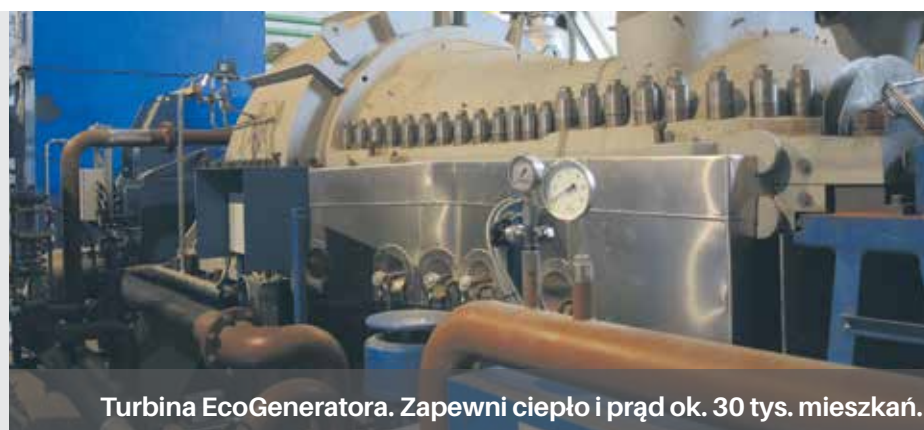
Turbina EcoGeneratora. Zapewni ciepło i prąd ok. 30 tys. mieszkań.