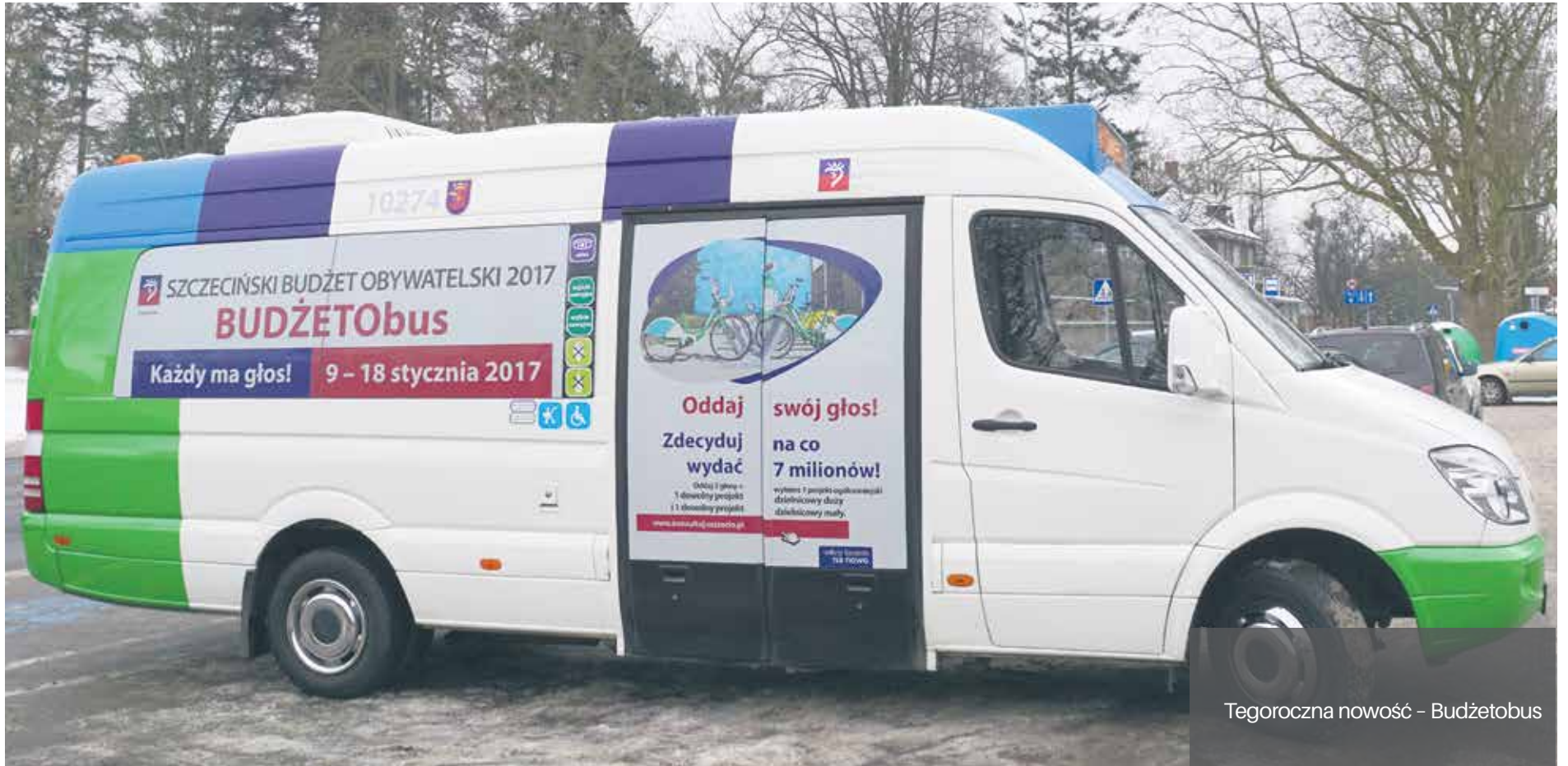
Tegoroczna nowość - Budżetobus

Tylko w głosowaniu internetowym wzięło udział 33359 osób oddając 92978 głosów na projekty zgłoszone do Szczecińskiego Budżetu Obywatelskiego.