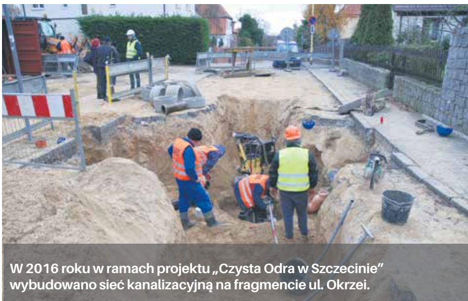
W 2016 roku w ramach projektu „Czysta Odra w Szczecinie” wybudowano sieć kanalizacyjną na fragmencie ul. Okrzei.

W najbliższych latach Zakład Wodociągów i Kanalizacji w Szczecinie realizować będzie projekt inwestycyjny „Czysta Odra w Szczecinie”, który otrzymał dofinansowanie ze środków Unii Europejskiej.