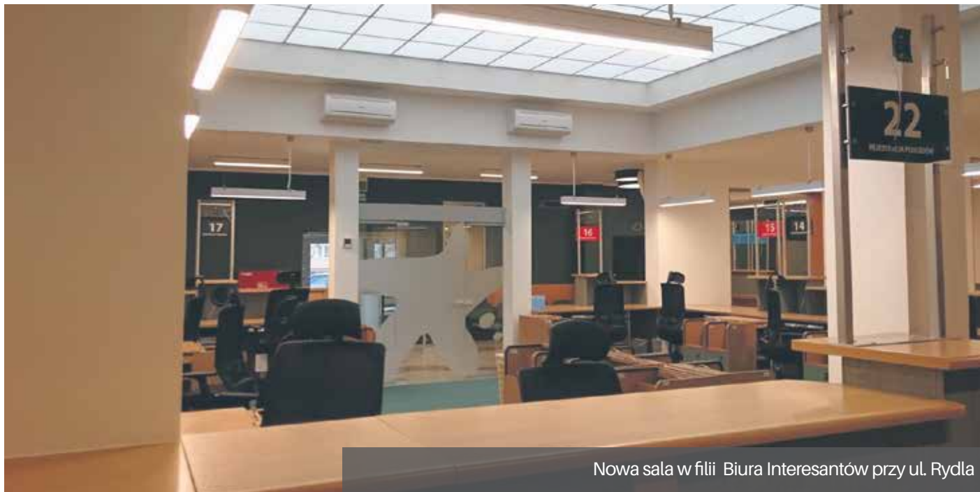
Nowa sala w filii Biura Interesantów przy ul. Rydla

Zakończył się remont sali Biura Obsługi Interesantów filii Urzędu Miasta przy ul. Rydla na Prawobrzeżu.