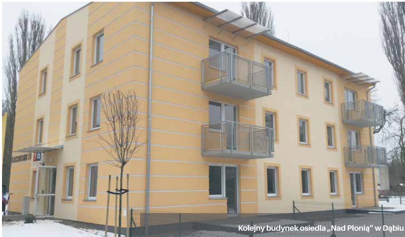
Kolejny budynek osiedla „Nad Płonią” w Dąbno

Lokale będą oddane do dyspozycji Gminy. TBS „Prawobrzeże” wynajmie je osobom wskazanym przez Zarząd Budynków i Lokali Komunalnych za czynsz równy