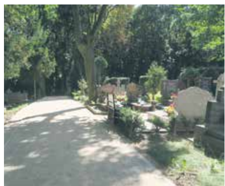
Nowa alejka na cmentarzu w Zdrojach