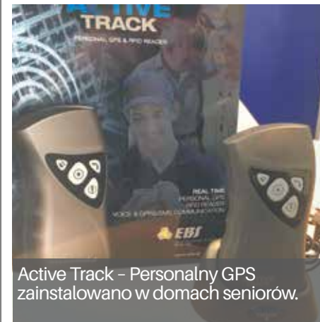
Active Track - Personalny GPS zainstalowano w domach seniorów.

To system monitoringu przeznaczony dla seniorów, znacznie poprawiający ich bezpieczeństwo oraz ułatwiający wezwanie pomocy w sytuacji bezpośredniego zagrożenia.