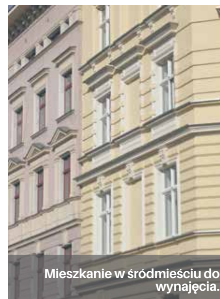
Mieszkanie w śródmieściu do wynajęcia.

Mieszkania dostępne są dla osób, które zdecydują się na wpłatę tzw. partycypacji. Jej koszt wynosi 1120 zł/m 2 w przypadku mieszkań położonych przy ul. Śląskiej, oraz 1266,74 zł/m 2 jeżeli chodzi o lokale przy ul. Obrońców Stalingradu. Bardzo ważne jest to, że wkład ten objęty jest gwarancją zwrotu i w sytuacji, kiedy lokator zechce zakończyć najem mieszkania, otrzyma zwaloryzowaną kwotę wkładu własnego.