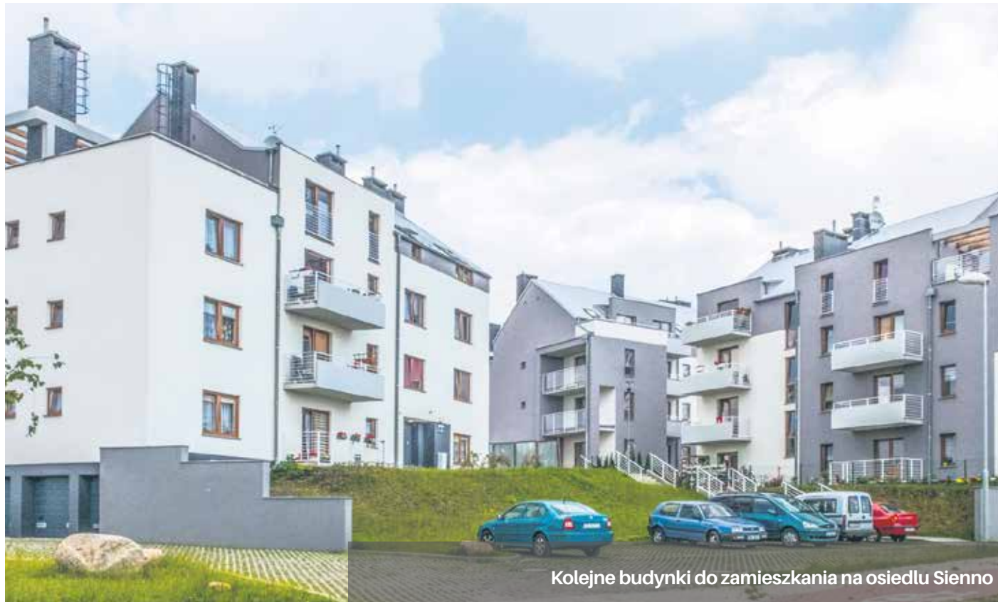
Kolejne budynki do zamieszkania na osiedlu Sienno

28 mieszkań (w tym 6 lokali dostosowanych dla osób niepełnosprawnych) - do dyspozycji Gminy Miasto Szczecin w ramach programu „Nowy dom”. Program ten jest skierowany do najemców