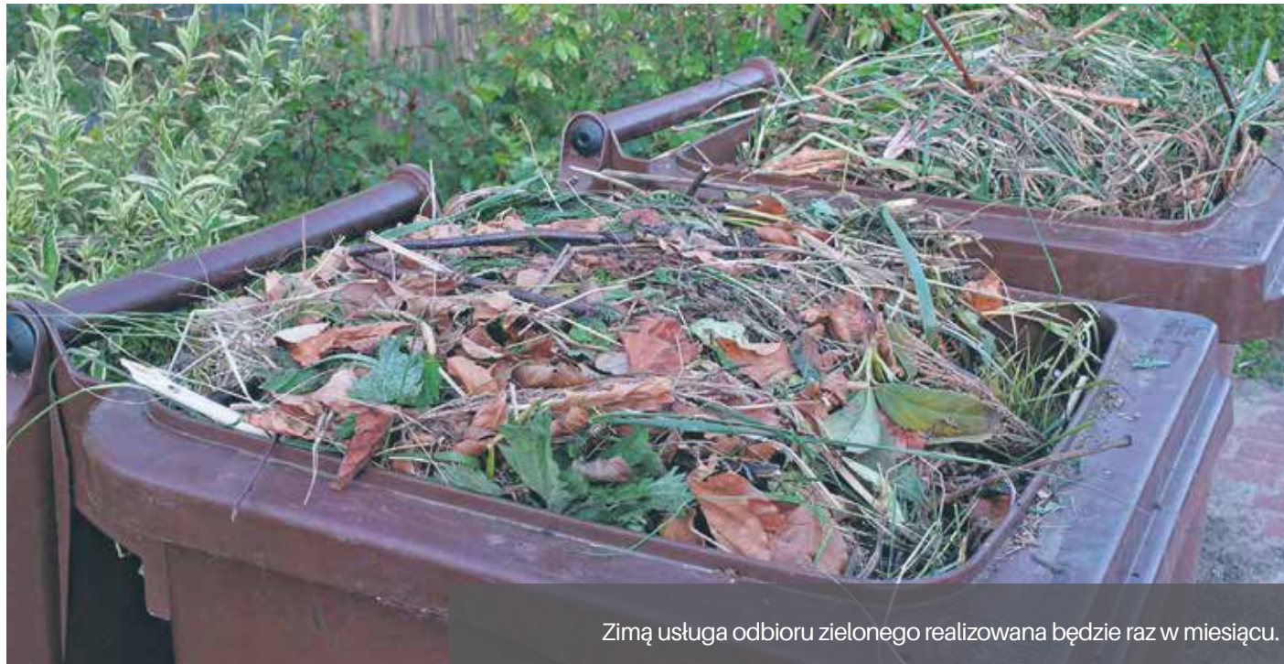
Zimą usługa odbioru zielonego realizowana będzie raz w miesiącu.

Zarządy, właściciele nieruchomości w zabudowie wielorodzinnej oraz placówki oświatowe również mogą skorzystać, od grudnia do końca marca, z usługi odbioru odpadów zielonych.