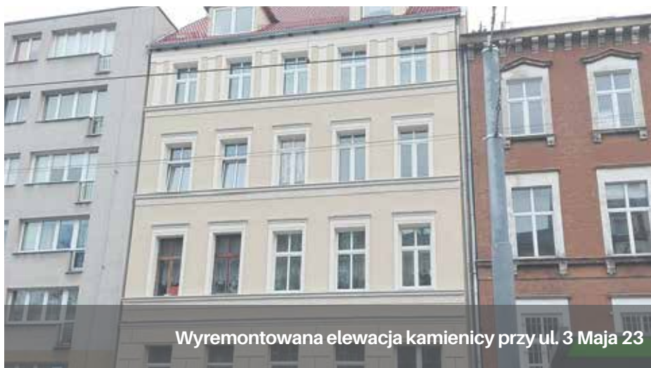
Wyremontowana elewacja kamienicy przy ul. 3 Maja 23

W 2016 r. Zarząd Budynków i Lokali Komunalnych wsparł wspólnoty mieszkaniowe w remontach budynków kwotą 12 mln zł. Większość inwestycji została już zrealizowana.