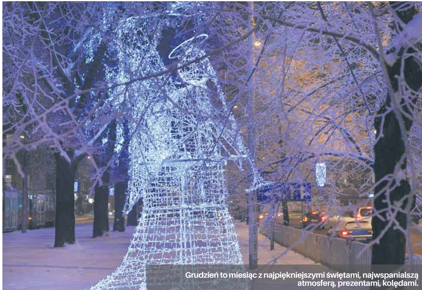
Grudzień to miesiąc z najpiękniejszymi świętami, najwspanialszą atmosferą, prezentami, kolędami.

Festiwal digital_ia.16 (16-18 grudnia 2016) to jedno z ważniejszych wydarzeń w Polsce, które podejmuje zagadnienia sztuki nowych mediów. Zaproszeni goście to artyści sztuk wizualnych i digitalnych, naukowcy, inżynierowie, wizjonerzy sztucznej inteligencji. Wydarzeniu zawsze towarzyszy nowa myśl przewodnia. W ostatnich latach były to: re_manufact (2015), techno_body (2014), bio_contact (2013) oraz inter_ak-