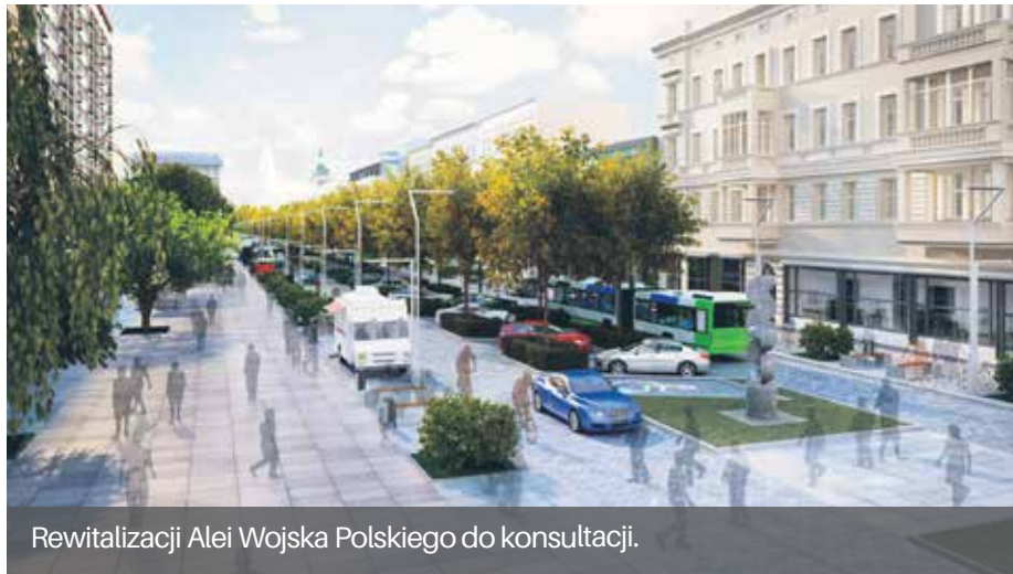
Rewitalizacji Alei Wojska Polskiego do konsultacji.

Każda Rada Osiedla wkrótce otrzyma komplet informacji związanych z wypracowanymi przez ostatnie dwa lata wariantami ruchu na alei oraz wynikami prowadzonych konsultacji i badań. Prezydent zwróci się z prośbą o wyrażenie wszelkich wątpliwości i obaw związanych z przygotowanymi przez miasto koncepcjami rewitalizacji. Po zebraniu opinii radnych, wśród szczecinian będzie