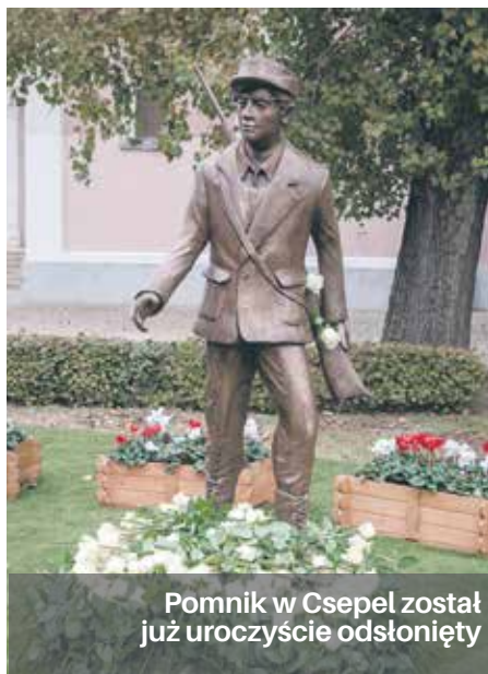
Pomnik w Csepel został już uroczystie odsłonięty

9 grudnia zostanie odsłonięty w Parku Kasprowicza, w sąsiedztwie Oddziału Instytutu Pamięci Narodowej (ul. P. Skargi 14) pomnik przedstawiający postać węgierskiego chłopca