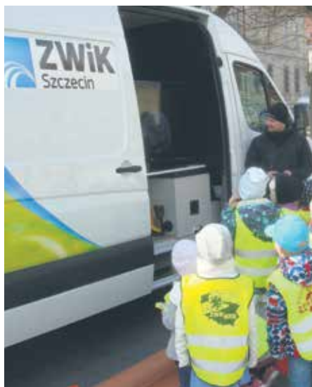
Kamerowóz prezentowaliśmy podczas licznych działań edukacyjnych.

Odwiedzający finał znajdą nas w namiocie sferycznym ustawionym na Łasztowni w pobliżu portu jachtowego. Prezentować w nim będziemy przede wszystkim realizowany przez Spółkę projekt inwestycyjny „Czysta Odra w Szczecinie”. Sporo wydarzy się obok namiotu. Tutaj skupimy się głównie na edukacji ekologicznej a także przekazywać będziemy informacje o naszej bieżącej pracy. Na młodszych i starszych uczestników finału czekać będzie wodny plac zabaw. Dzięki pomocy grupy animatorów nasi goście zbudują tu m.in. własną tamę, elektrownię wodną a także zestaw do oczyszczania wody. Nie zabraknie konkursów i gier. Będzie wodny tor wyścigowy,