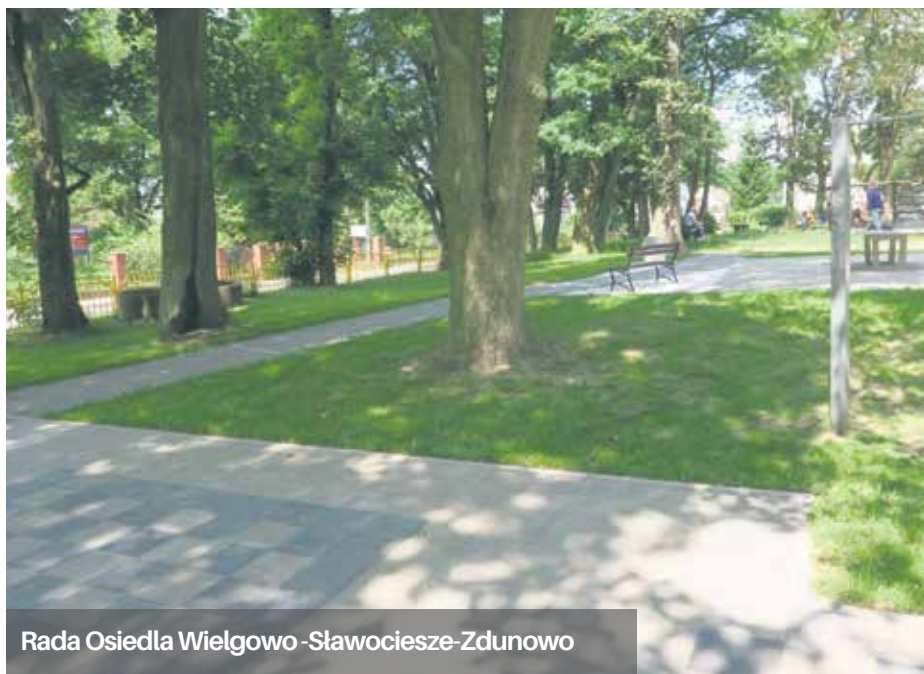
Rada Osiedla Wielgowo-Sławociesz-Zdunowo

Zakończono również drugi etap zagospodarowania terenu leśnego przy ulicy Bałtyckiej i Wiślanej . Mieszkańcy Wielgowa w pełni mogą już korzystać z nowości, które zostały sfinansowane przez Radę Osiedla Wielgowo-Sławociesz-Zdunowo .