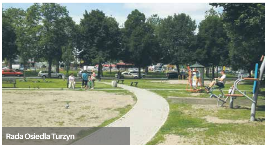
Rada Osiedla Turzyn

Niektóre inwestycje są już zakończone, inne w trakcie realizacji, kolejne zaplanowane na najbliższy czas. Celem modernizacji i zagospodarowania terenów jest nie tylko poprawienie estetyki i funkcjonalności otoczenia, ale przede wszystkim stworzenie miejsc odpoczynku i rekreacji dla mieszkańców naszego miasta.