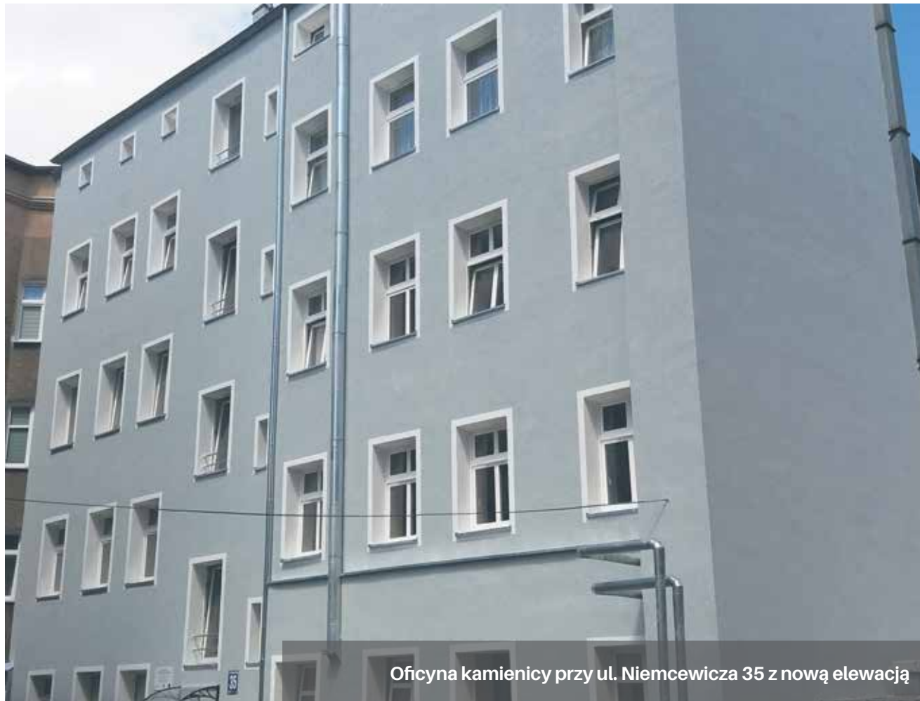
Oficyna kamienicy przy ul. Niemcewicza 35 z nową elewacją