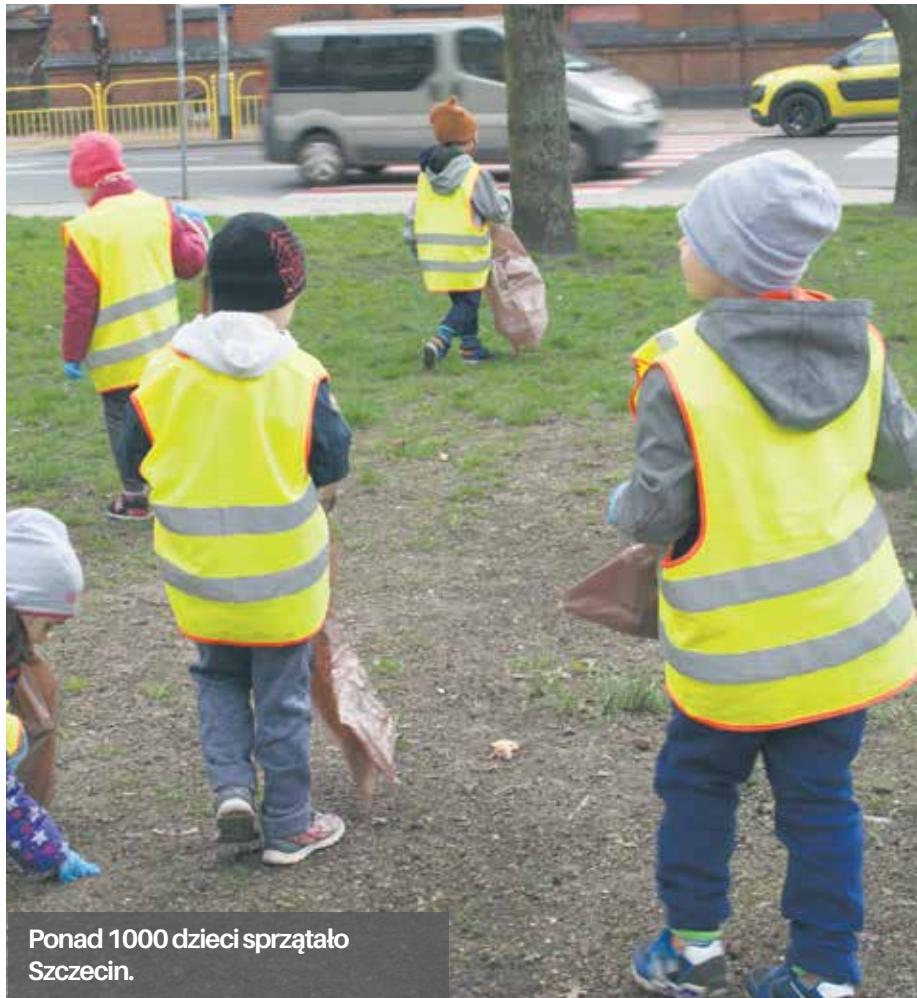
Ponad 1000 dzieci sprzątało Szczecin.

Wśród niezliczonej ilości papieru, szklanych butelek, opakowań plastikowych itd. znaleźli także stare opony, odpady wielkogabarytowe, poremontowe, zużyty sprzęt elektryczny i elektroniczny oraz odpady pochodzące z demontażu pojazdów. Zebrane przez młodzież odpady