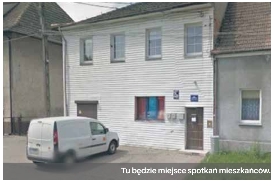
Tu będzie miejsce spotkań mieszkańców.

Budynek Rady Osiedlowej przy ul. Bałtyckiej ma być miejscem spotkań mieszkańców.