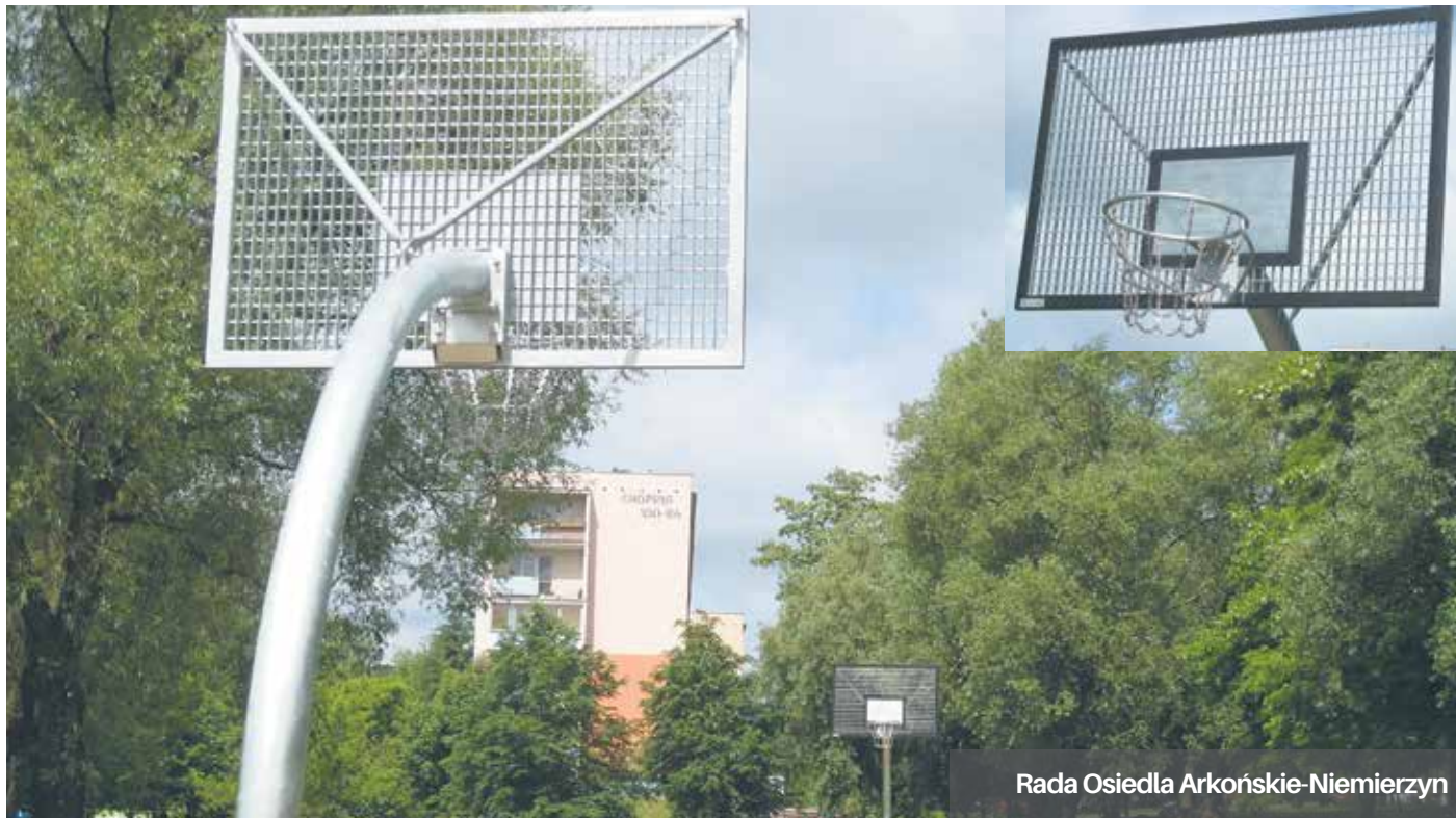
Rada Osiedla Arkońskie-Niemierzyn

Pod koniec maja kosze oddano do użytku mieszkańców.