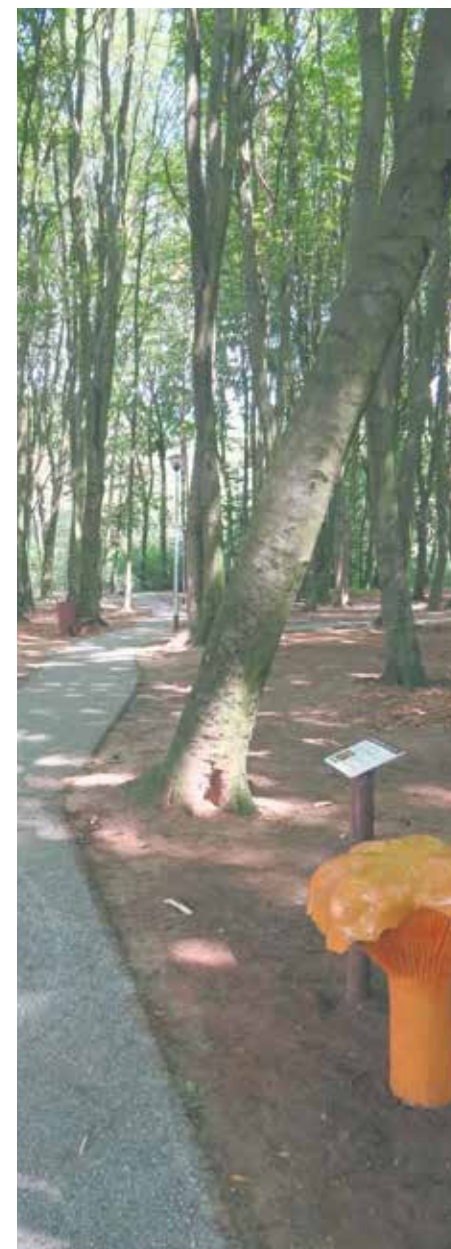
Rada Osiedla Wielgowo-Sławociesz-Zdunowo

Na terenie przy ulicy Bałtyckiej dostępna jest ścieżka edukacyjna. Wzdłuż niej ustawiono modele grzybów wraz z opisami poszczególnych gatunków. Nauczyciele w tym miejscu będą więc mogli organizować dla swoich podopiecznych zajęcia z przyrody. Ułożone zostały także alejki żwirowe. Miejsca pod istniejącą siłownią pod chmurką zostały utwardzone, podobnie jak pod stołami do szachów. Zamontowano ławki parkowe oraz leśne, a przy nich pojawiły się kosze na śmieci. Północna część parku zyskała nowe oświetlenie.