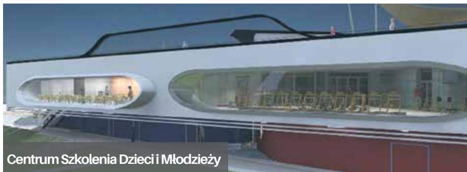
Centrum Szkolenia Dzieci i Młodzieży