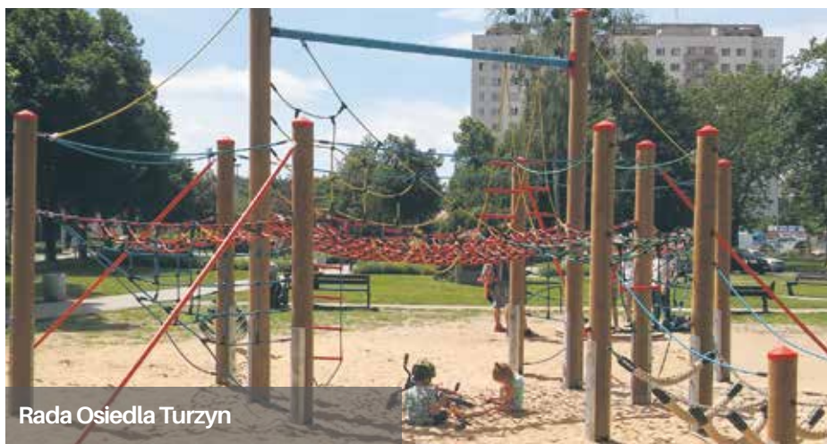
Rada Osiedla Turzyn

Ostatni etap modernizacji skweru im. Dołiwo - Dobrowolskiego zakończono!