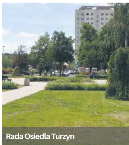
Rada Osiedla Turzyn

Ustawiono również elementy małej architektury tj. ławki i kosze oraz dokonano pielęgnacji zieleni. Na terenie skweru powstały alejki umożliwiające swobodną komunikację. Inwestycja była współfinansowana przez Radę Osiedla Turzyn . Zdecydowanie przyczyniła się do wzrostu atrakcyjności tej części miasta.