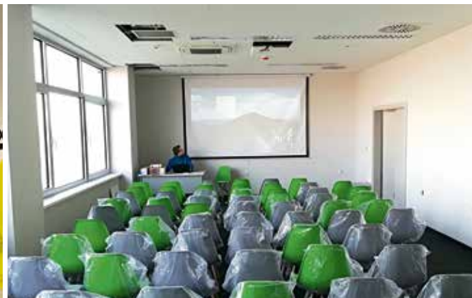
EcoGenerator pod parą, kaski i kamizelki czekają w szatni na pierwszych gości, sala konferencyjna gotowa.

grup szkolnych prowadzone na terenie EcoGeneratora.