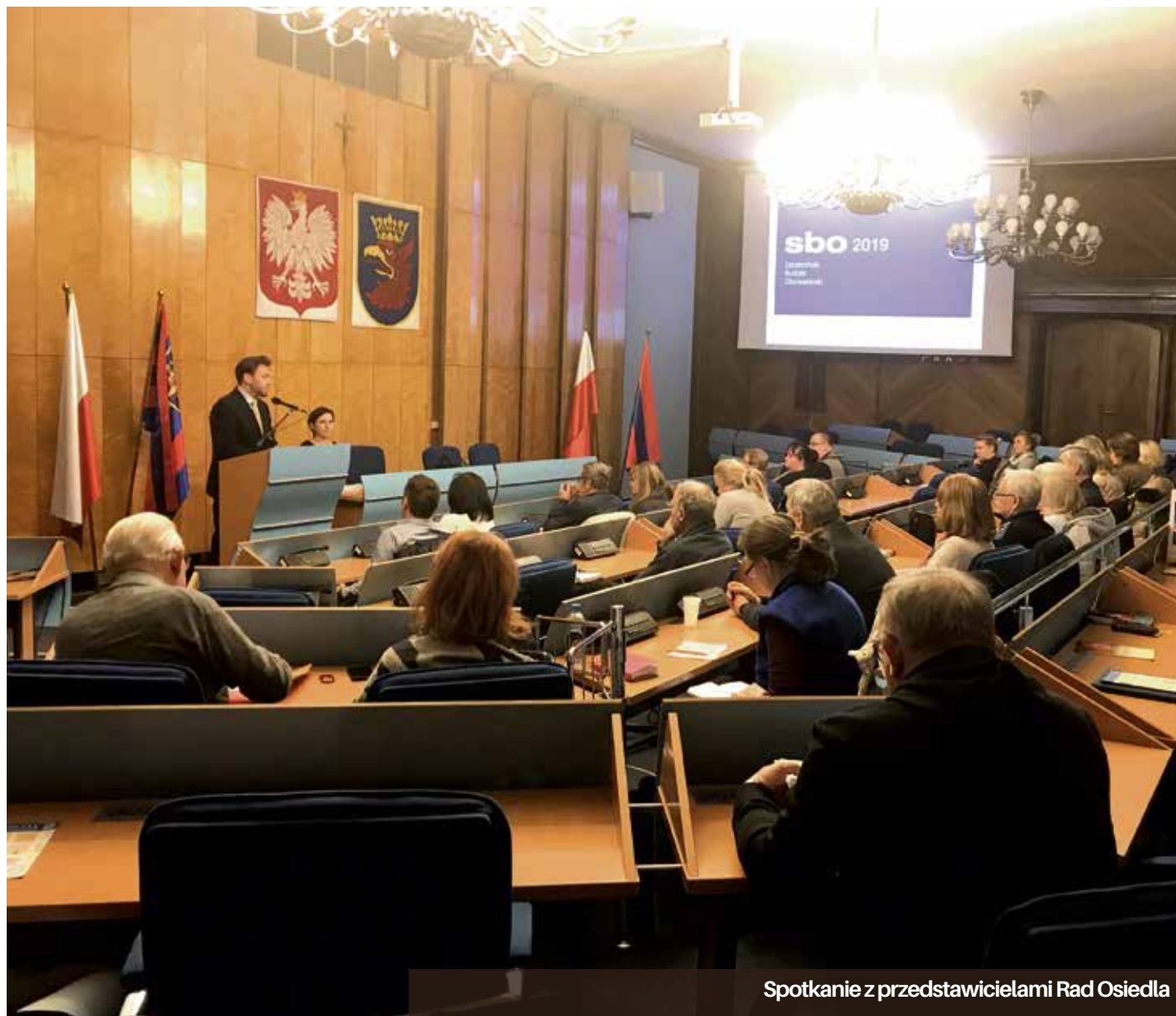
Spotkanie z przedstawicielami Rad Osiedla

Kolejnym udogodnieniem ma być utworzenie infolinii telefonicznej dla mieszkańców, którzy będą chcieli skorzystać z pomocy