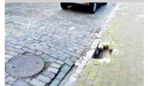
Zapadnięty chodnik przy ul. Żółkiewskiego