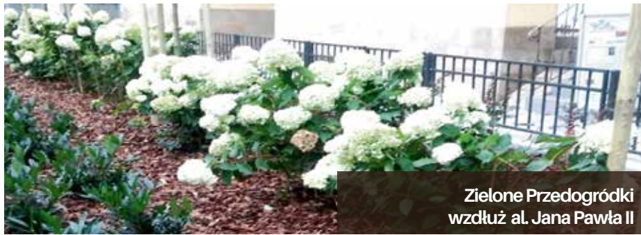
Zielone Przedogródki wzdłuż al. Jana Pawła II

Kolejna szansa dla mieszkańców na zmianę swojego otoczenia. Wspólnoty mieszkaniowe jeszcze przez kilka dni mogą składać wnioski na realizację projektów w ramach programów: Zielone Podwórka i Zielone Przedogródki Szczecina. W tym roku do podziału jest 3 miliony złotych.