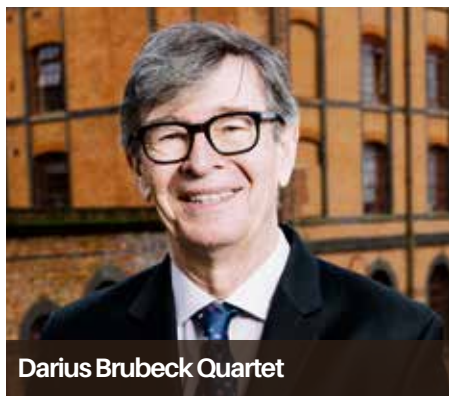
Dariusz Brubeck Quartet