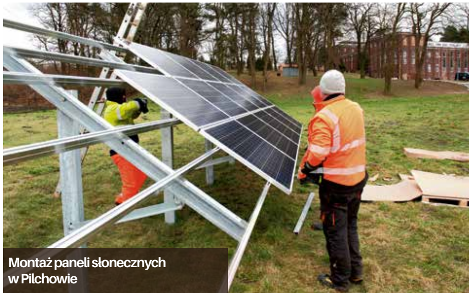
Montaż paneli słonecznych w Pilchowie

Kolejna farma fotowoltaiczna będzie wytwarzała energię dla Zakładu Wodociągów i Kanalizacji w Szczecinie. Nowe kolektory montowane są na terenie Zakładu Produkcji Wody w Pilchowie.