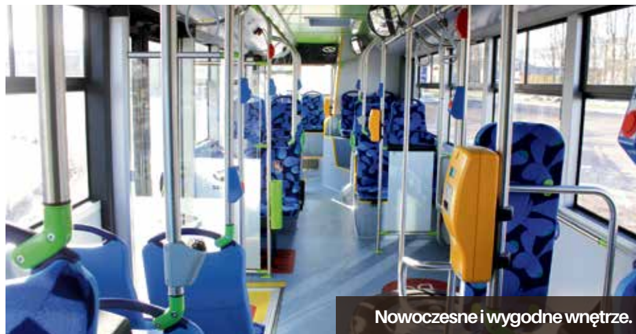
Nowoczesne i wygodne wnętrze.

Cztery nowoczesne autobusy, z dwudziestu zakupionych przez Miasto Szczecin, trafiły do Zajezdni Dąbie. Kolejnych sześć dotrze jeszcze w tym miesiącu, a pozostałe w marcu. Nowe autobusy zaczną przewozić pasażerów za kilka tygodni.