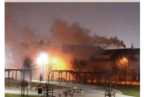
Zadymienie przy parku Majowym

Z nowej, ulepszonej wersji aplikacji Alert Szczecin 2.0 można korzystać w urządzeniu mobilnym (telefon, tablet) opartym na Androidzie, systemie iOS czy Windows Phone.