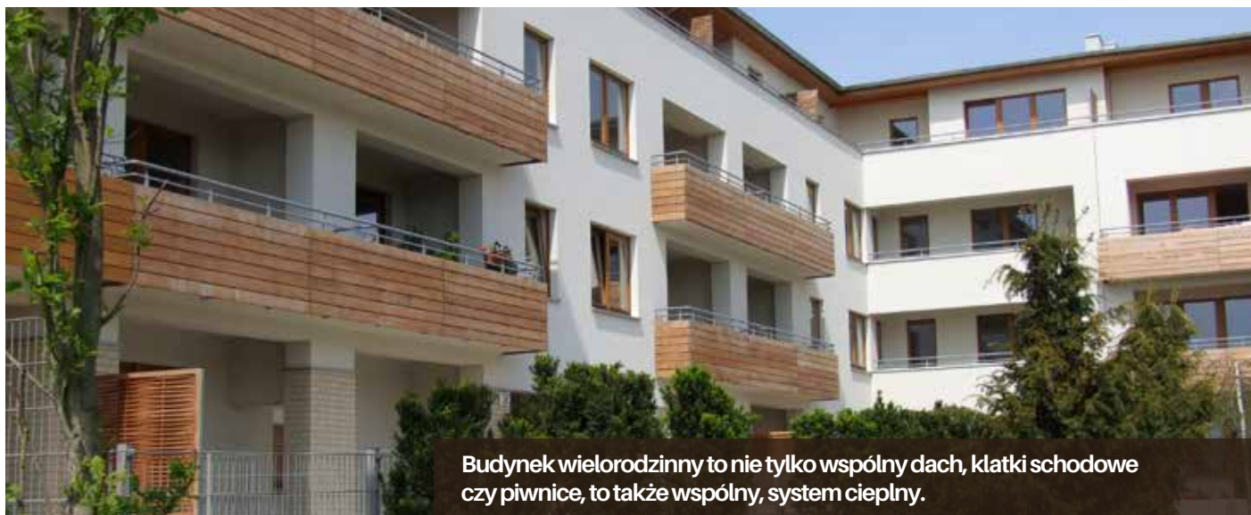
Budynek wielorodzinny to nie tylko wspólny dach, klatki schodowe czy piwnice, to także wspólny, system ciepły.

Charakterystyczne dla tego okresu jest czasami bardzo duże zróżnicowanie ilości ciepła pobieranego przez poszczególne lokale. Mieszkania często są zasiedlane stopniowo i do czasu rozpoczęcia użytkowania wszystkich pomieszczeń, lokale zasiedlone pośrednio ogrzewają również te niezamieszkałe, a także przyległe części wspólne.