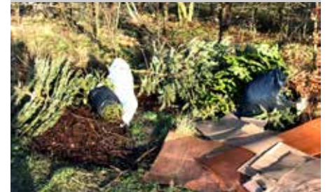
Dzikie wysypisko przy ul. Kredowej