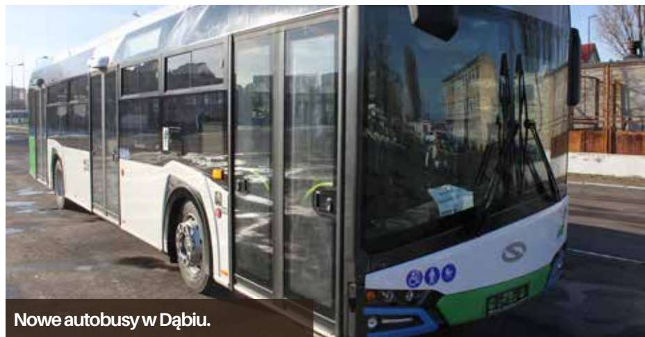
Nowe autobusy w Dąbiu.