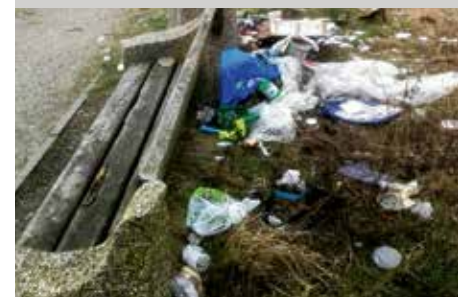
Nabrzeże Cegielinka (ul. Eskadrowa) „Krajobraz po bitwie”