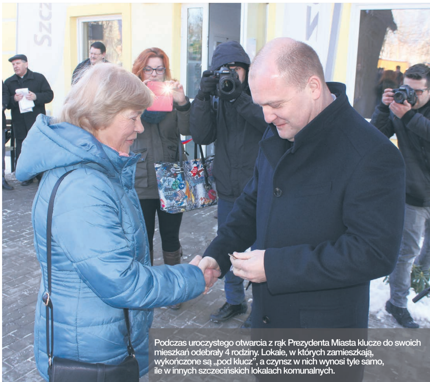
Podczas uroczystego otwarcia z rąk Prezydenta Miasta klucze do swoich mieszkań odebrały 4 rodziny. Lokale, w których zamieszkają, wykończone są „pod klucz”, a czynsz w nich wynosi tyle samo, ile w innych szczecińskich lokalach komunalnych.

A wszystko to w centrum Starego-Dąbia, które rewitalizowane jest przez TBS od 2002 roku. Osiedle „Nad Płonią” położone jest przy bocznej uliczce