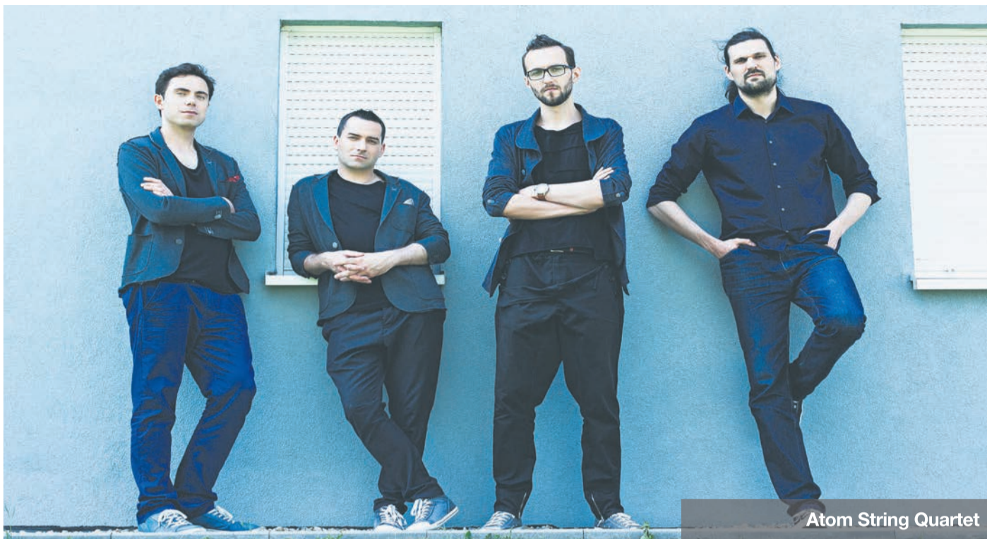
Atom String Quartet