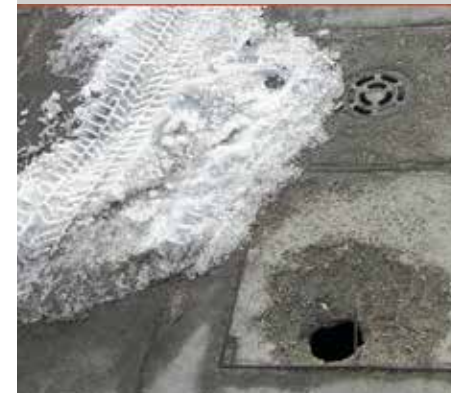
ul. Batalionów Chłopskich - uszkodzona pokrywa studzienki

Z nowej ulepszonej wersji aplikacji Alert Szczecin 2.0 można korzystać w urządzeniu mobilnym (telefon, tablet) opartym na Androidzie, systemie iOS czy Windows Phone.