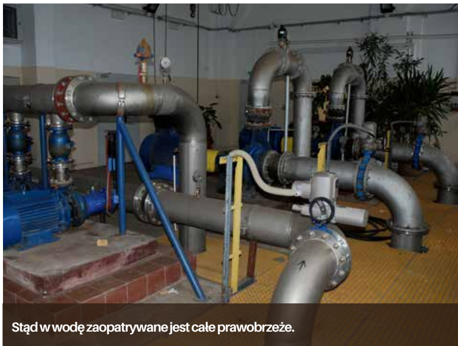
Stąd w wodę zaopatrywane jest całe prawobrzeże.

ZWiK zakończył niezwykle istotną inwestycję dla mieszkańców prawobrzeża. Gruntowny remont przeszła pompownia wody w Kijewie. Dzięki niemu zagwarantowana została niezawodność dostaw wody dla mieszkańców tej części Szczecina.