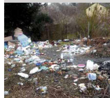
Dzikie wysypisko przy ul. Arkońskiej