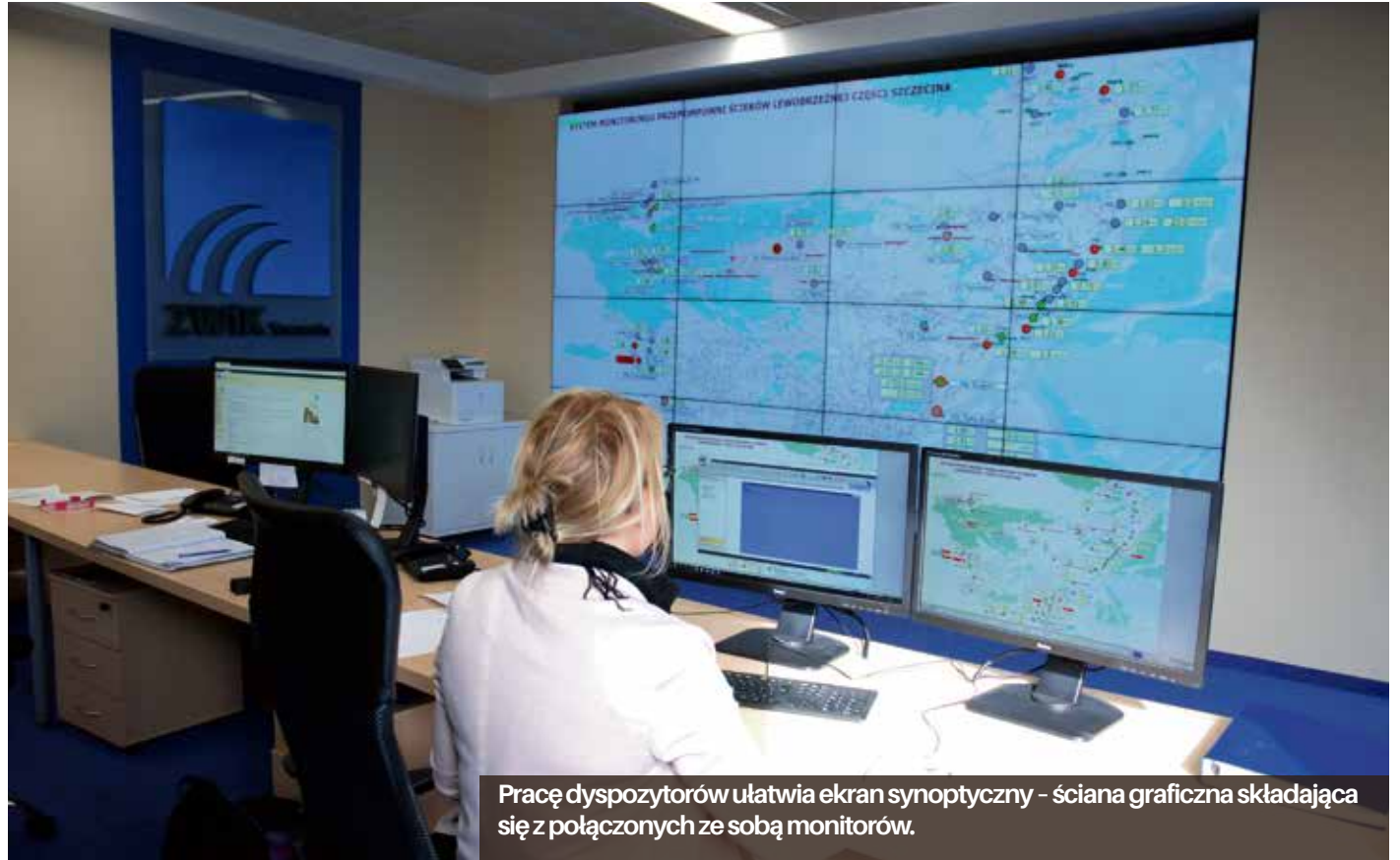
Pracę dyspozytorów ułatwia ekran synoptyczny – ściana graficzna składająca się z połączonych ze sobą monitorów.

W trakcie inwestycji przygotowano stanowiska dla dyspozytorów i pomieszczenia dla pracowników pogotowia wodnokanalizacyjnego. Do nowej dyspozytorni