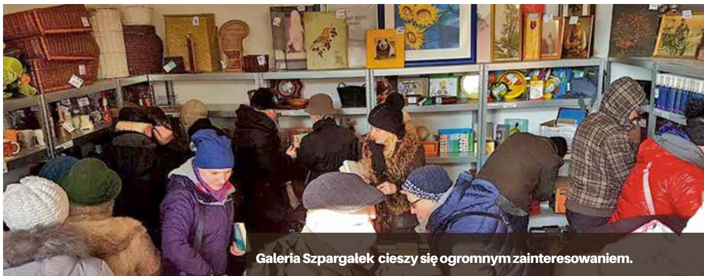
Galeria Szpargałek cieszy się ogromnym zainteresowaniem.

Podczas tylko trzech dni funkcjonowania Galerii Szpargałek odwiedziło już niemal tysiąc osób, które łącznie wspomogły organizację charytatywne kwotą prawie 9 tys. zł.