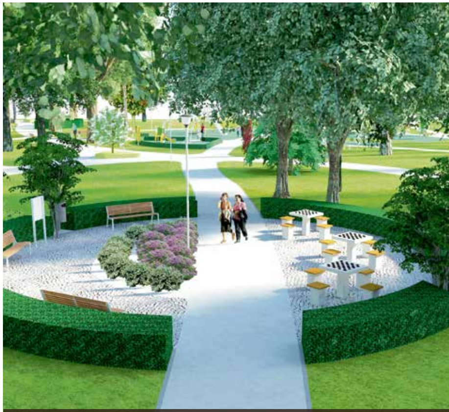
Już wkrótce tak będzie wyglądał skwer im. Telesfora Badetki

Zakres prac budowlanych obejmować będzie teraz m.in. rozbiórkę istniejących obiektów gospodarczych, budowę fontanny w centralnej części placu, placu zabaw dla dzieci młodszych, także chodnika-bieżni o długości 200 m, ogrodzonego wybiegu