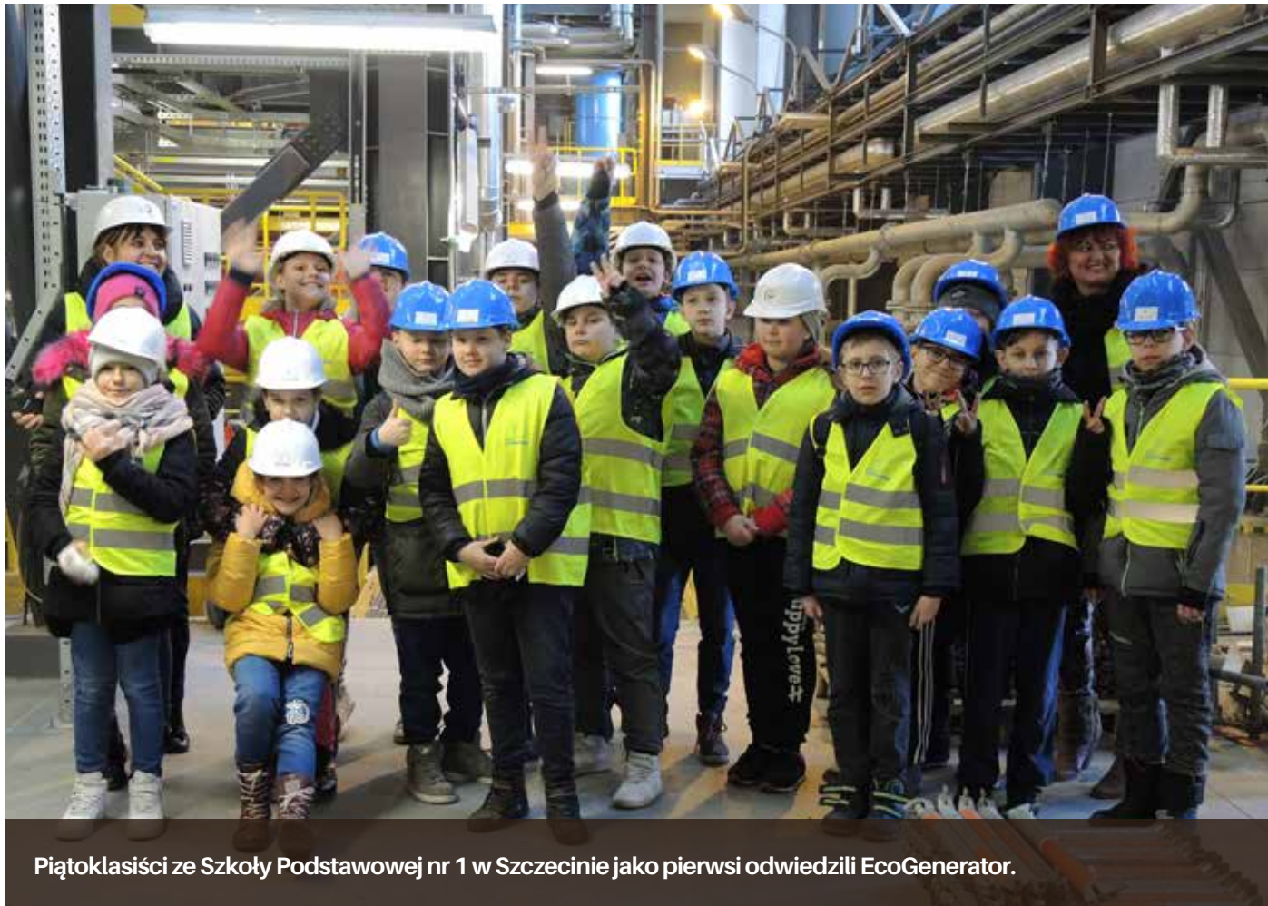
Piątoklasiści ze Szkoły Podstawowej nr 1 w Szczecinie jako pierwsi odwiedzili EcoGenerator.