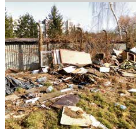
Likwidacja garażowiska przy ul. Wiśniowy Sad