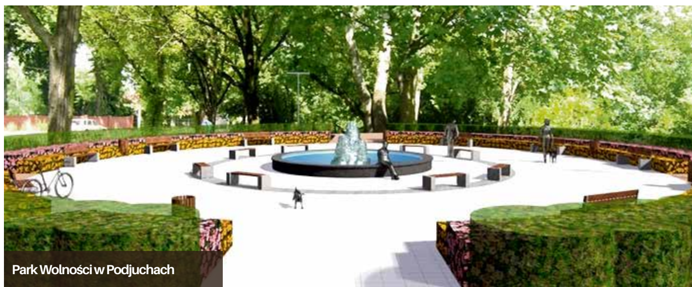
Park Wolności w Podjuchach